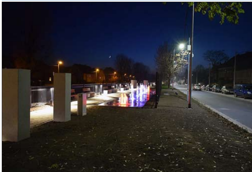
Nowa fontanna na Grabach w Strzegomiu z tryskającą wodą w białoczerwonych barwach