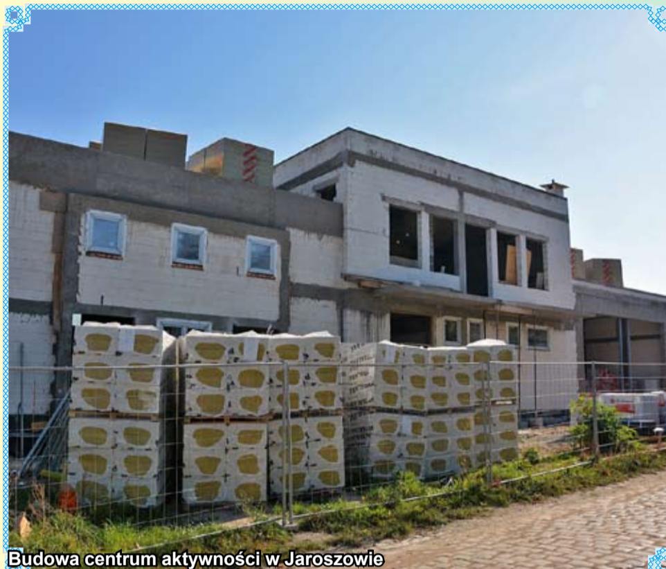
Budowa centrum aktywności w Jaroszowie