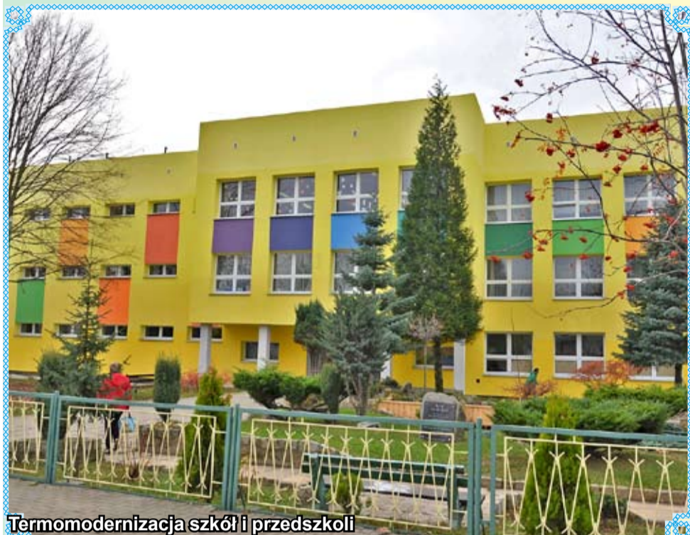
Termomodernizacja szkół i przedszkoli

Budowa krytej pływalni Delfinek, rozpoczęcie budowy przedszkola pasywnego, termomodernizacja szkół i przedszkoli, budowa Alei Rzeźb – to tylko niektóre z przedsięwzięć realizowanych przez strzegomski samorząd na przestrzeni ostatnich lat. Dzięki znacznym nakładom na inwestycje, Strzegom zmienia się nie do poznania.