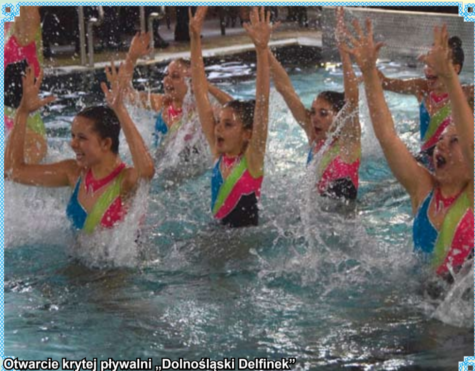
Otwarcie krytej pływalni „Dolnośląski Delfinek”