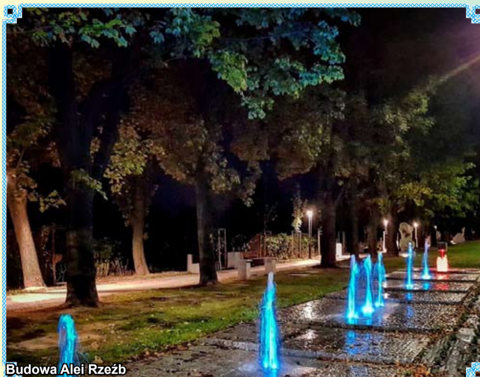
Budowa Alei Rzeźb