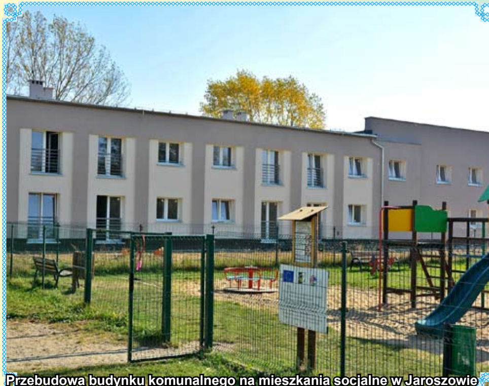
Przebudowa budynku komunalnego na mieszkania socjalne w Jaroszowie