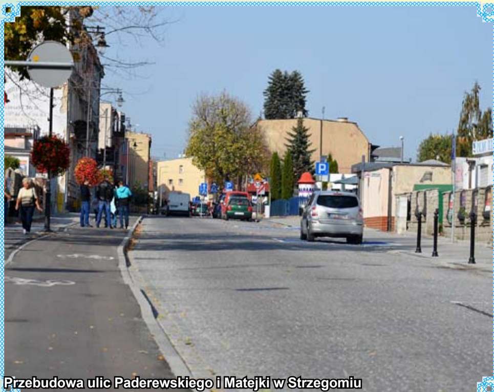
Przebudowa ulic Paderewskiego i Matejki w Strzegomiu