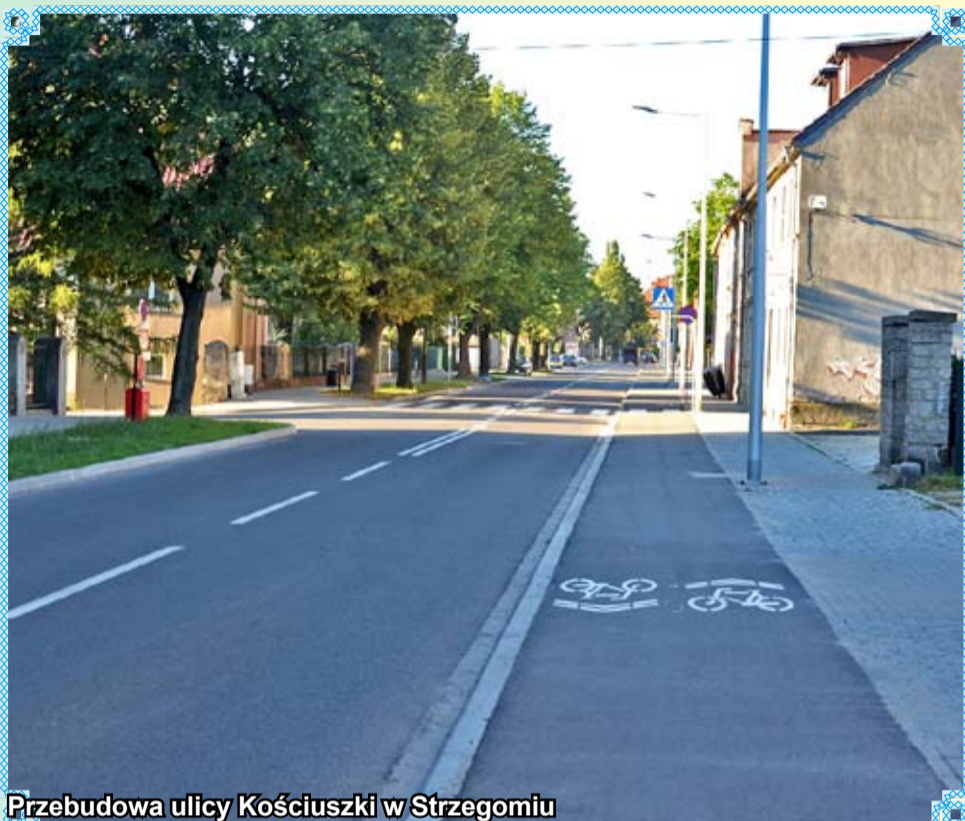
Przebudowa ulicy Kościuszki w Strzegomiu