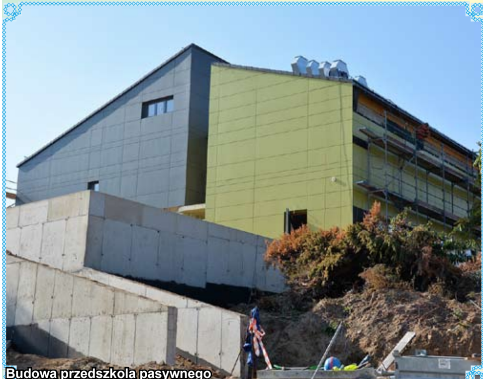
Budowa przedszkola pasywnego