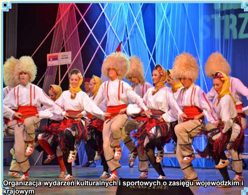
Organizacja wydarzeń kulturalnych i sportowych o zasięgu wojewódzkim i krajowym