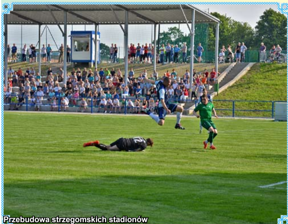
Przebudowa strzegomskich stadionów