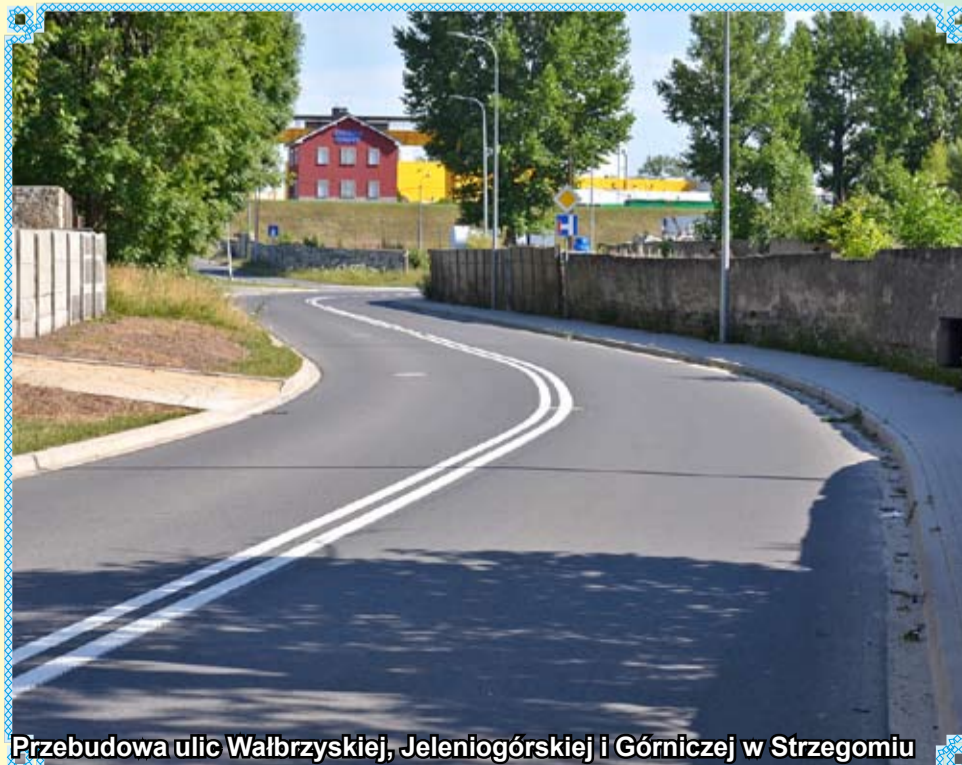
Przebudowa ulic Wałbrzyskiej, Jeleniogórskiej i Górniczej w Strzegomiu