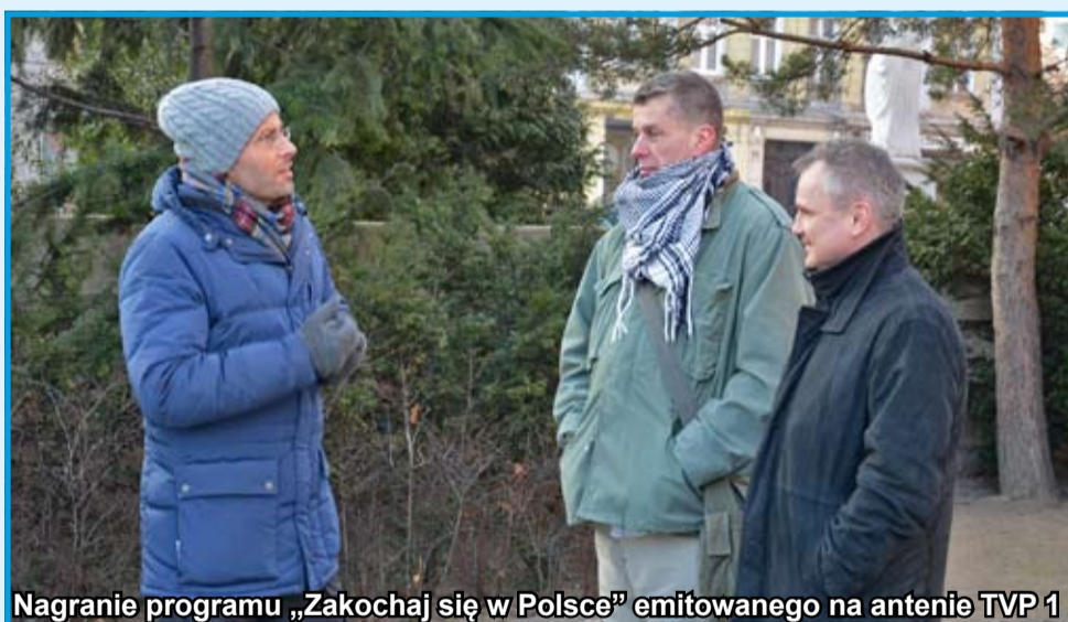
Nagranie programu „Zakochaj się w Polsce” emitowanego na antenie TVP 1