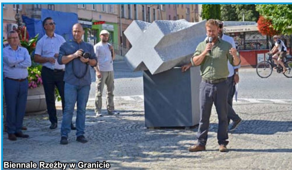
Biennale Rzeźby w Granicie