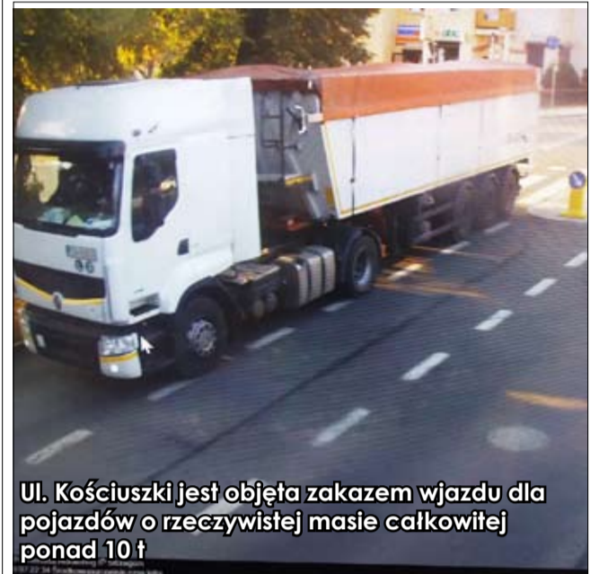
Ul. Kościuszki jest objęta zakazem wjazdu dla pojazdów o rzeczywistej masie całkowitej ponad 10 t

Zdjęcia sprawcy oraz mężczyzny mu towarzyszącemu przekazano Policji. Następnego dnia ok. godz. 08.20 obserwujący monitoring pracownik zauważył, że w jednej z kamer spaceruje sprawca włamania do automatu przy ul. Leśnej. Wezwani na miejsce strzegomscy