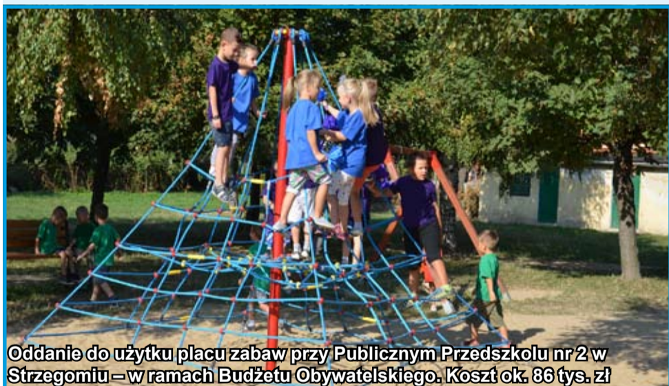
Oddanie do użytku placu zabaw przy Publicznym Przedszkolu nr 2 w Strzegomiu – w ramach Budżetu Obywatelskiego. Koszt ok. 86 tys. zł