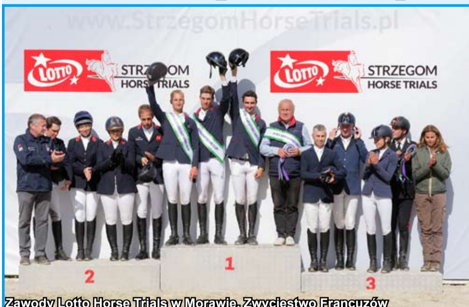
Zawody Lotto Horse Trials w Morawie. Zwycięstwo Francuzów