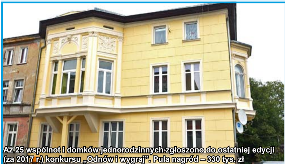
Aż 25 wspólnot i domków jednorodzinnych zgłoszono do ostatniej edycji (za 2017 r.) konkursu „Odnów i wygraj”. Pula nagród – 330 tys. zł