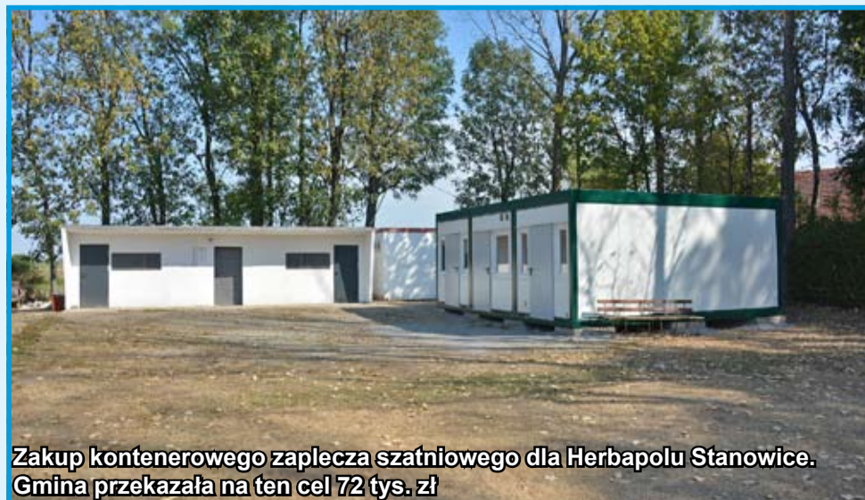
Zakup kontenerowego zaplecza szatniowego dla Herbapolu Stanowice. Gmina przekazała na ten cel 72 tys. zł