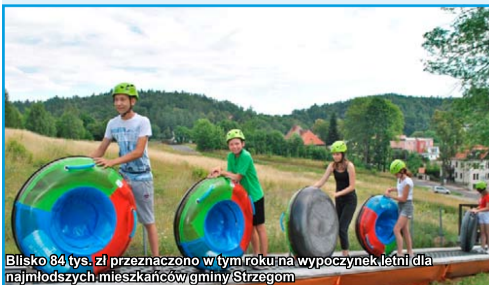
Blisko 84 tys. zł przeznaczono w tym roku na wypoczynek letni dla najmłodszych mieszkańców gminy Strzegom