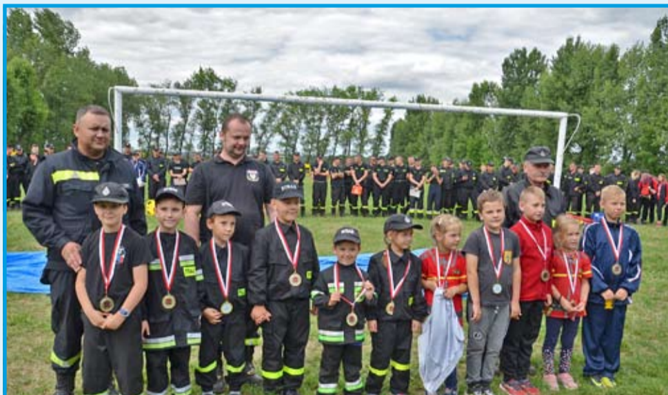
Gminne zawody pożarnicze strażaków OSP gminy Strzegom. Samorząd pozyskał blisko 82 tys. zł na sprzęt strażacki z ministerstwa sprawiedliwości