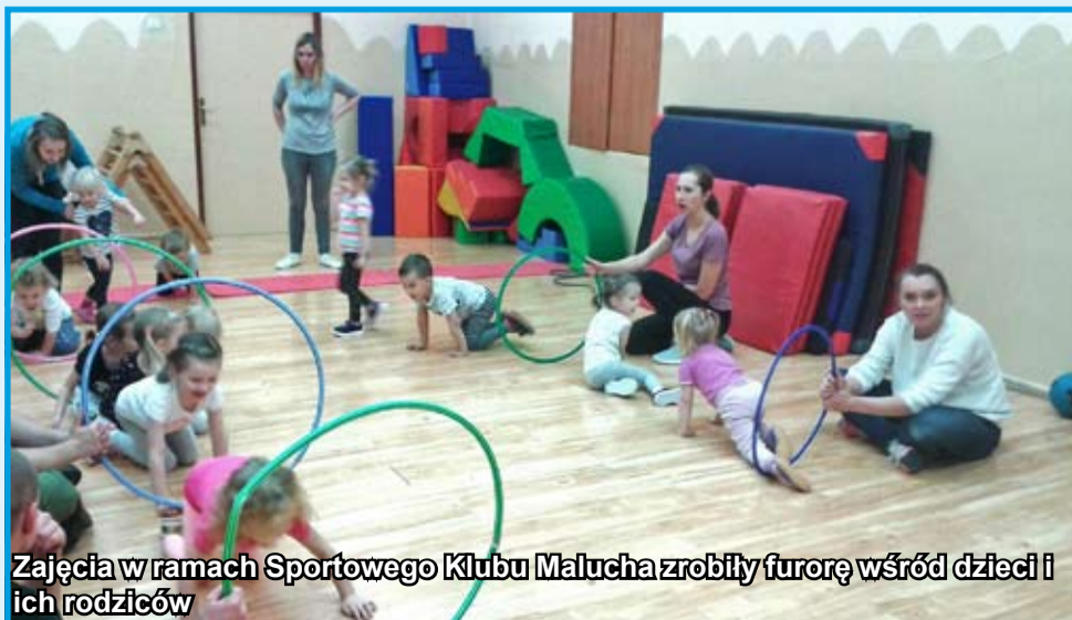
Zajęcia w ramach Sportowego Klubu Malucha zrobiły furorę wśród dzieci i ich rodziców