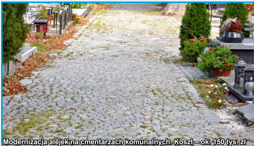
Modernizacja alejek na cmentarzach komunalnych. Koszt – ok. 150 tys. zł