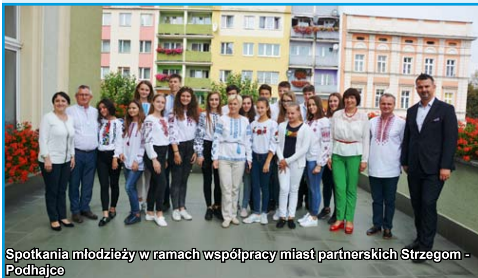
Spotkania młodzieży w ramach współpracy miast partnerskich Strzegom - Podhajce