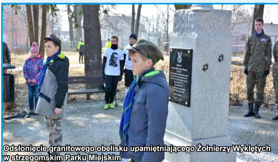
Odświeżenie granitowego obelisku upamiętniającego Żołnierzy Wyklętych w Strzegomskim Parku Miejskim