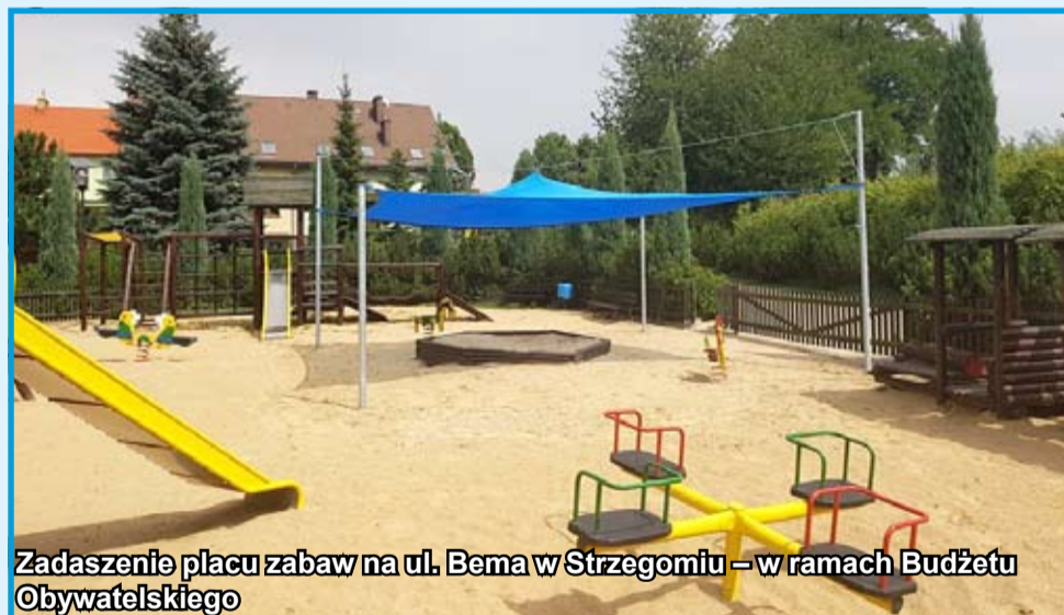
Zadaszenie placu zabaw na ul. Bema w Strzegomiu – w ramach Budżetu Obywatelskiego