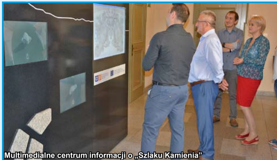
Multimedialne centrum informacji o „Szlaku Kamienia”