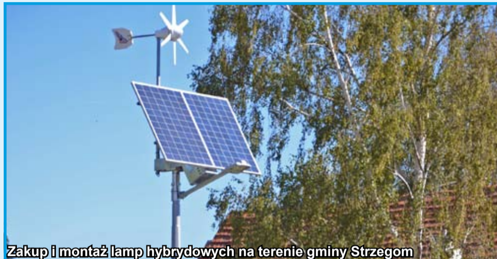
Zakup i montaż lamp hybrydowych na terenie gminy Strzegom