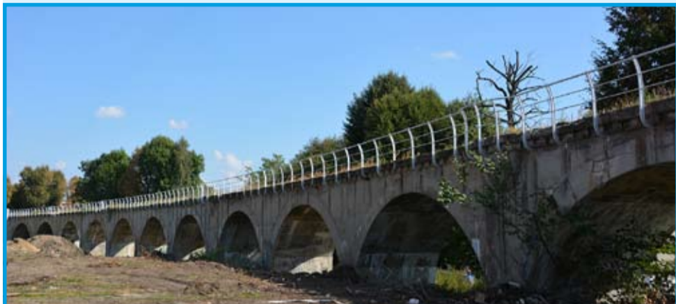
Przebudowa i zagospodarowanie przestrzeni publicznej na terenie Grabiny i Starego Miasta. Koszt prac – ok. 9,9 mln zł, dofinansowanie – ok. 5,5 mln zł

W kilku poprzednich wydaniach „Gminnych Wiadomości Strzegom” prezentowaliśmy cykl podsumowań związanych z kończąca się kadencją 2014–2018. W ostatnim numerze rozpoczęliśmy prezentację przedsięwzięć zrealizowanych w 2018 r. W tym wydaniu kontynuujemy ten wątek.