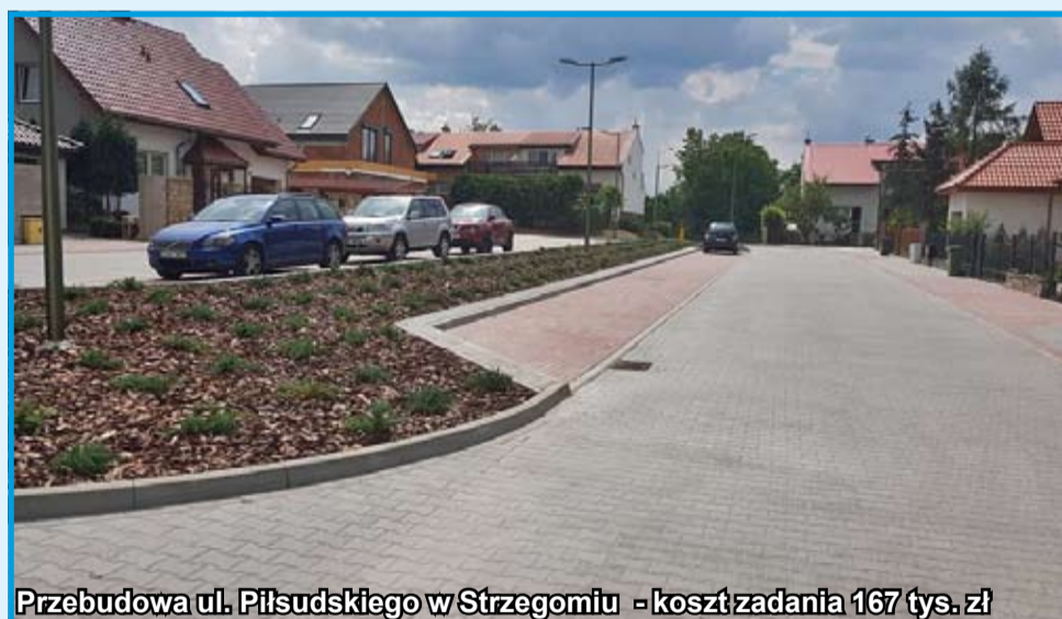
Przebudowa ul. Piłsudskiego w Strzegomiu - koszt zadania 167 tys. zł