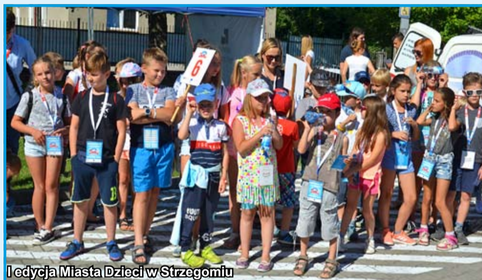
I edycja Miasta Dzieci w Strzegomiu