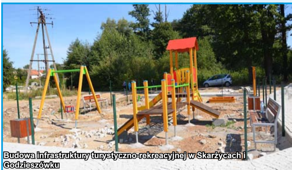
Budowa infrastruktury turystyczno-rekreacyjnej w Skarżycach i Godzieszówku