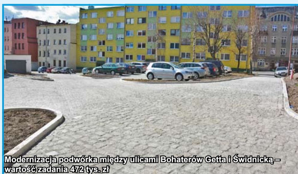
Modernizacja podwórka między ulicami Bohaterów Getta i Świdnicką – wartość zadania 472 tys. zł