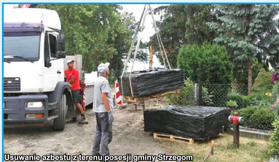
Usuwanie azbestu z terenu posesji gminy Strzegom