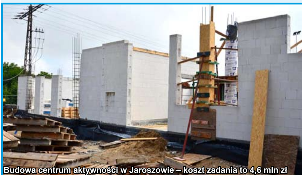
Budowa centrum aktywności w Jaroszowie – koszt zadania to 4,6 mln zł