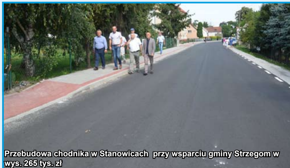
Przebudowa chodnika w Stanowicach przy wsparciu gminy Strzegom w wys. 265 tys. zł