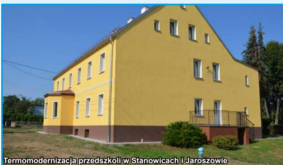
Termomodernizacja przedszkoli w Stanowicach i Jaroszowie