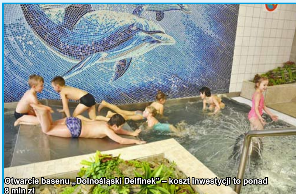
Otwarcie basenu „Dolnośląski Delfinek” – koszt inwestycji to ponad 8 mln zł