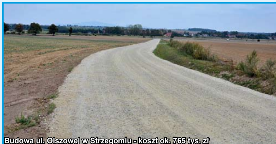
Budowa ul. Olszowej w Strzegomiu - koszt ok. 765 tys. zł