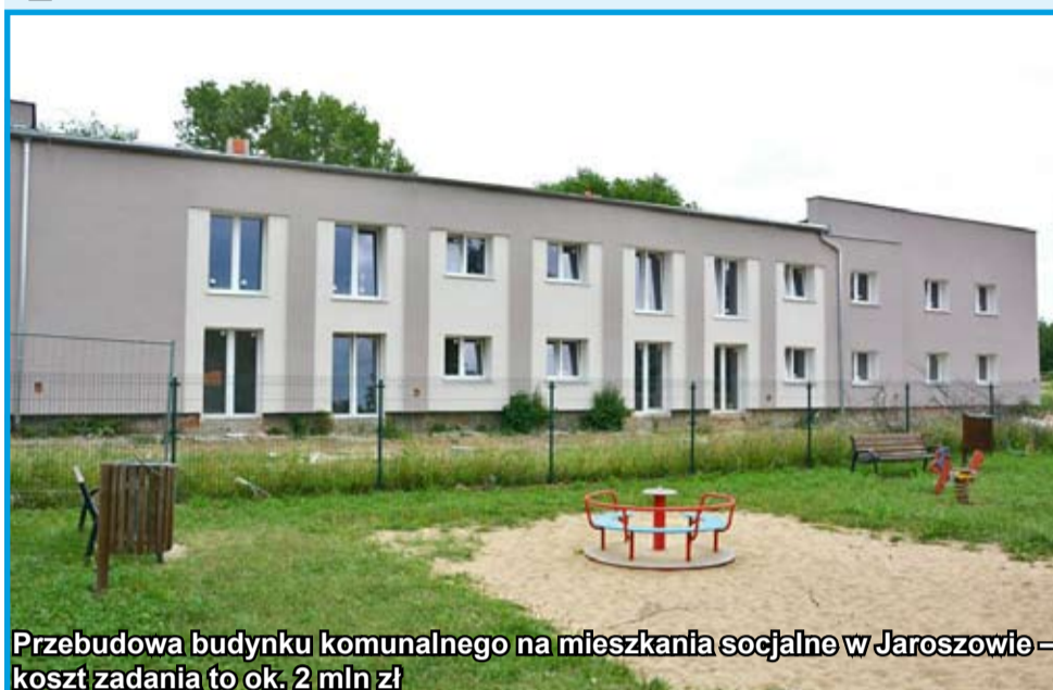
Przebudowa budynku komunalnego na mieszkania socjalne w Jaroszowie – koszt zadania to ok. 2 mln zł