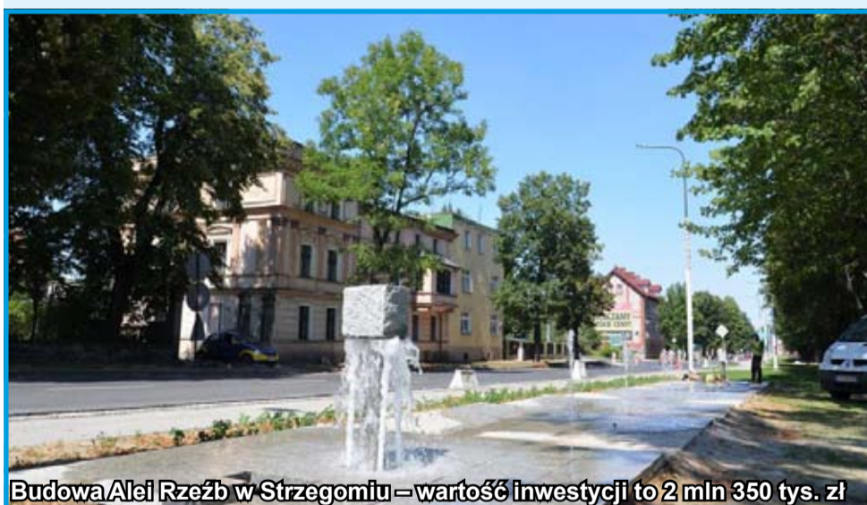
Budowa Alei Rzeźb w Strzegomiu – wartość inwestycji to 2 mln 350 tys. zł