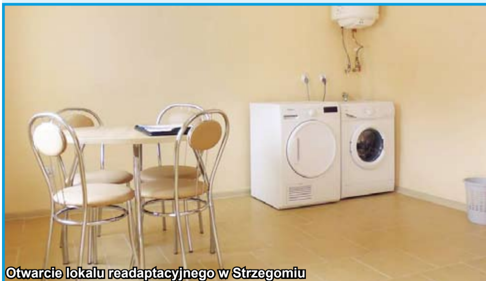
Otwarcie lokalu readaptacyjnego w Strzegomiu