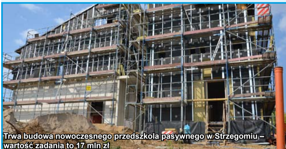
Trwa budowa nowoczesnego przedszkola pasywnego w Strzegomiu – wartość zadania to 17 mln zł

W poprzednich wydaniach „Gminnych Wiadomości Strzegom” prezentowaliśmy cykl podsumowań związanych z kończąca się kadencją 2014–2018. W ostatnim numerze zakończyliśmy prezentację przedsięwzięć zrealizowanych w 2017 r. W tym wydaniu rozpoczynamy opis działań podejmowanych przez strzegomski samorząd w 2018 r.