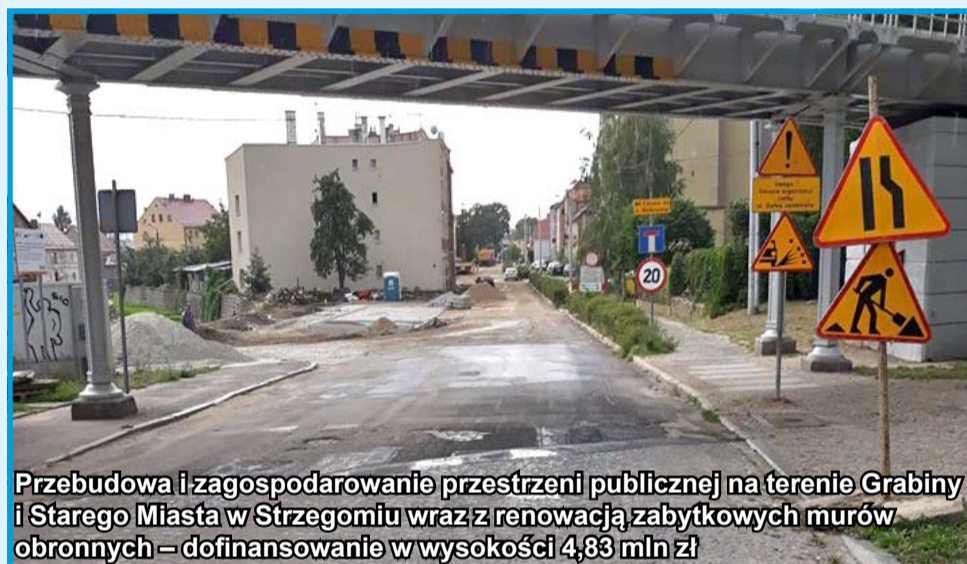
Przebudowa i zagospodarowanie przestrzeni publicznej na terenie Grabiny i Starego Miasta w Strzegomiu wraz z renowacją zabytkowych murów obronnych – dofinansowanie w wysokości 4,83 mln zł