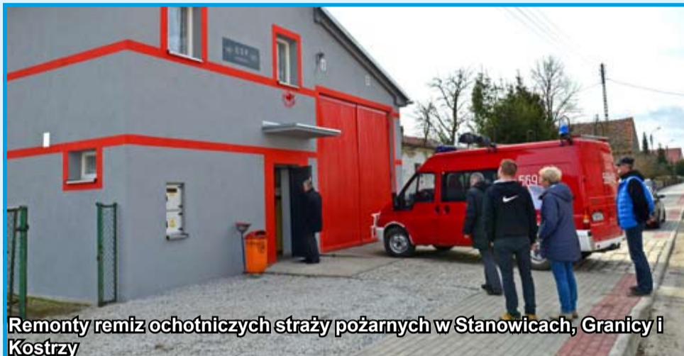
Remonty remiz ochotniczych straży pożarnych w Stanowicach, Granicy i Kostrzy