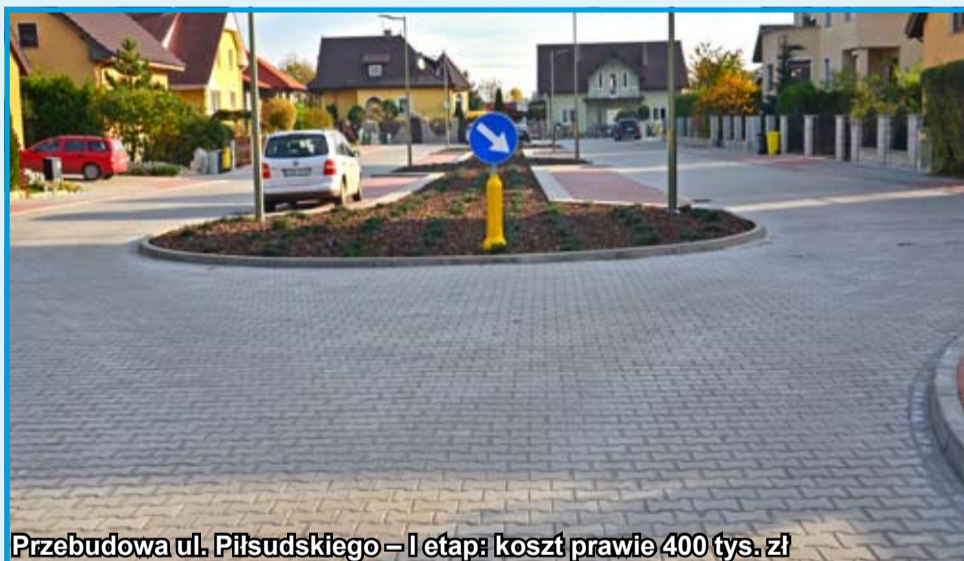
Przebudowa ul. Piłsudskiego – I etap: koszt prawie 400 tys. zł