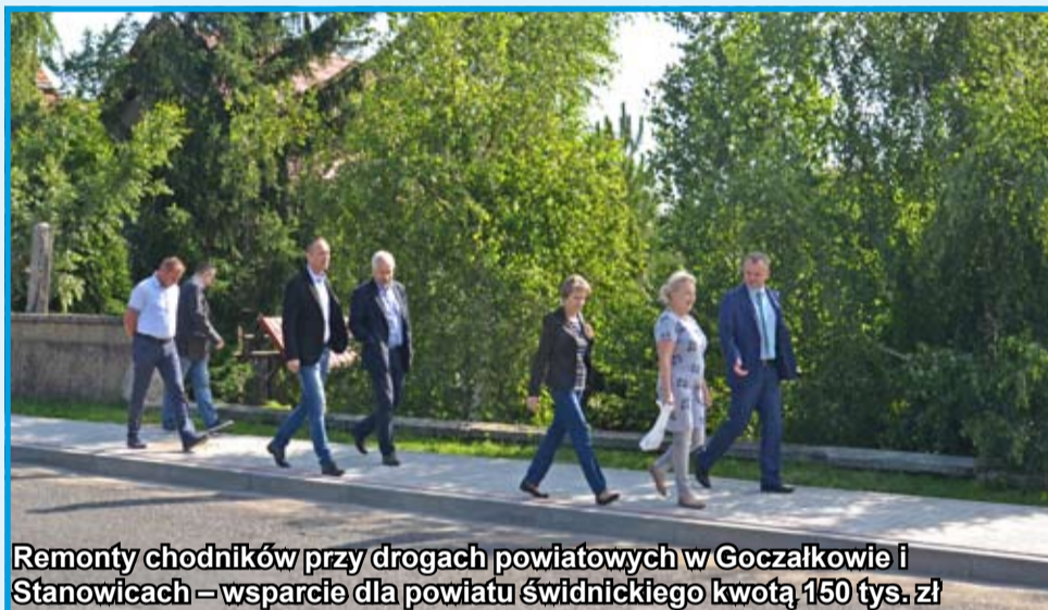
Remonty chodników przy drogach powiatowych w Goczałkowie i Stanowicach – wsparcie dla powiatu świdnickiego kwotą 150 tys. zł