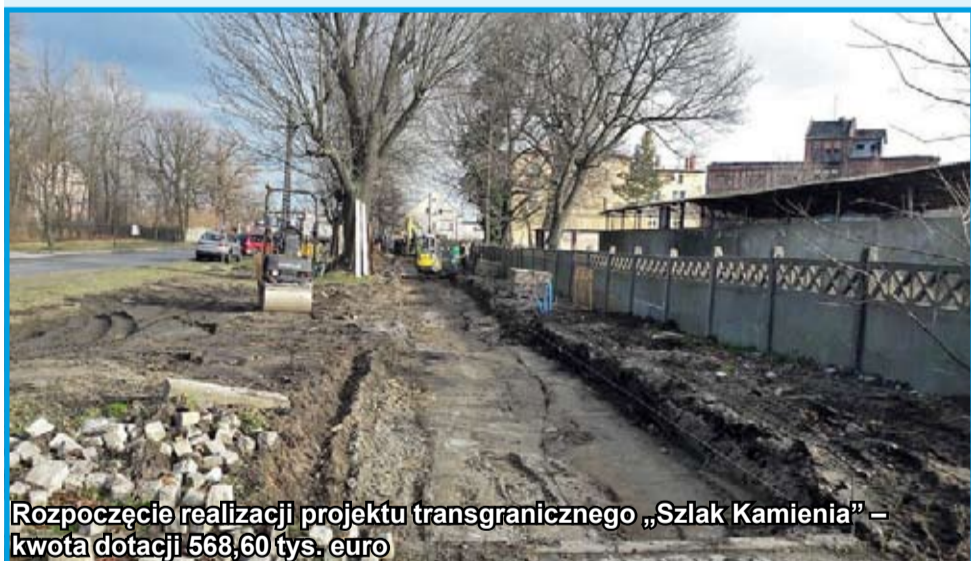
Rozpoczęcie realizacji projektu transgranicznego „Szlak Kamienia” – kwota dotacji 568,60 tys. euro