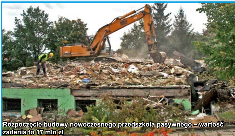
Rozpoczęcie budowy nowoczesnego przedszkola pasywnego – wartość zadania to 17 mln zł