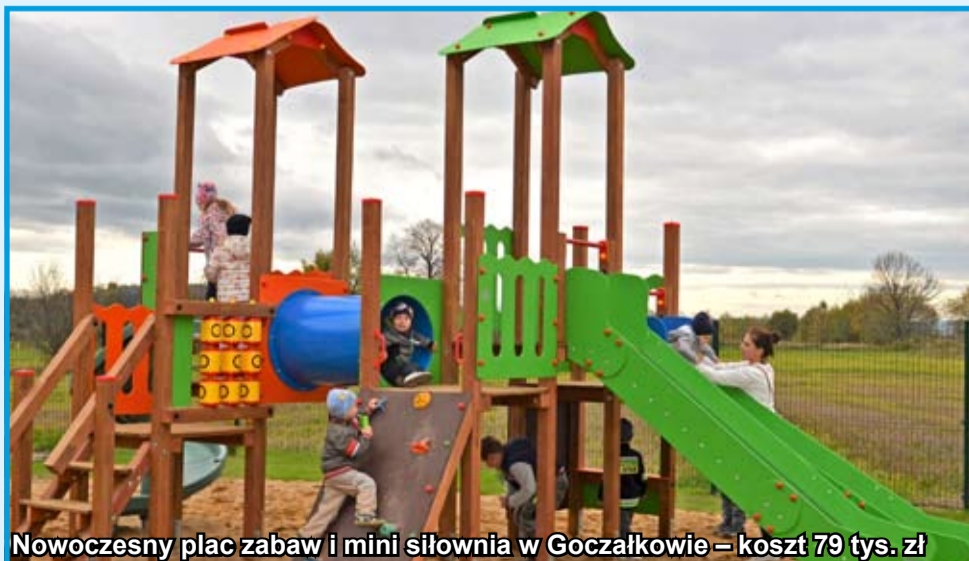
Nowoczesny plac zabaw i mini siłownia w Goczałkowie – koszt 79 tys. zł