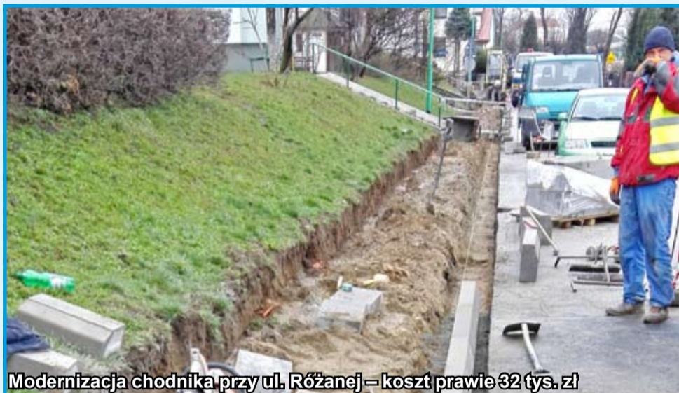
Modernizacja chodnika przy ul. Różanej – koszt prawie 32 tys. zł