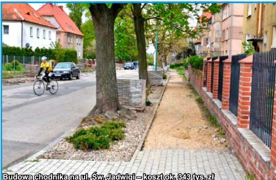
Budowa chodnika na ul. Św. Jadwigi – koszt ok. 343 tys. zł