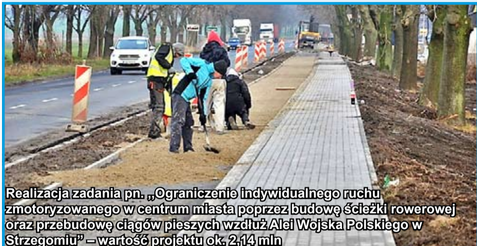
Realizacja zadania pn. „Ograniczenie indywidualnego ruchu zmotoryzowanego w centrum miasta poprzez budowę ścieżki rowerowej oraz przebudowę ciągów pieszych wzdłuż Alei Wojska Polskiego w Strzegomiu” – wartość projektu ok. 2,14 mln

W poprzednich numerach „Gminnych Wiadomości Strzegom” prezentowaliśmy cykl podsumowań związany z kończąca się kadencją 2014 – 2018. W kolejnych wydaniach przypomnieliśmy inwestycje realizowane w latach 2015 i 2016. W tym numerze rozpoczynamy podsumowanie roku 2017, w którym wydatki na inwestycje wyniosły aż 22 mln zł. Dzięki temu udało się zrealizować wiele przedsięwzięć, na które strzegomianie czekali już od wielu lat. Nie brakowało inwestycji w mieście i na wsiach. W następnym wydaniu kontynuacja 2017 r.