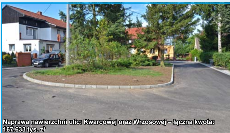
Naprawa nawierzchni ulic: Kwarcowej oraz Wrzosowej – łączna kwota: 167.633 tys. zł