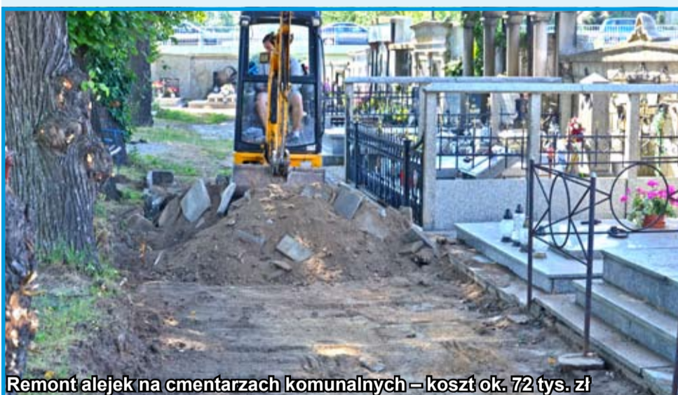
Remont alejek na cmentarzach komunalnych – koszt ok. 72 tys. zł