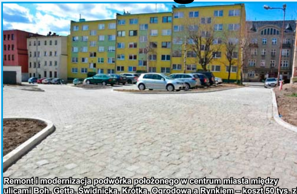
Remont i modernizacja podwórka położonego w centrum miasta między ulicami Boh. Getta, Świdnicką, Krótką, Ogrodową a Rynkiem – koszt 50 tys. zł