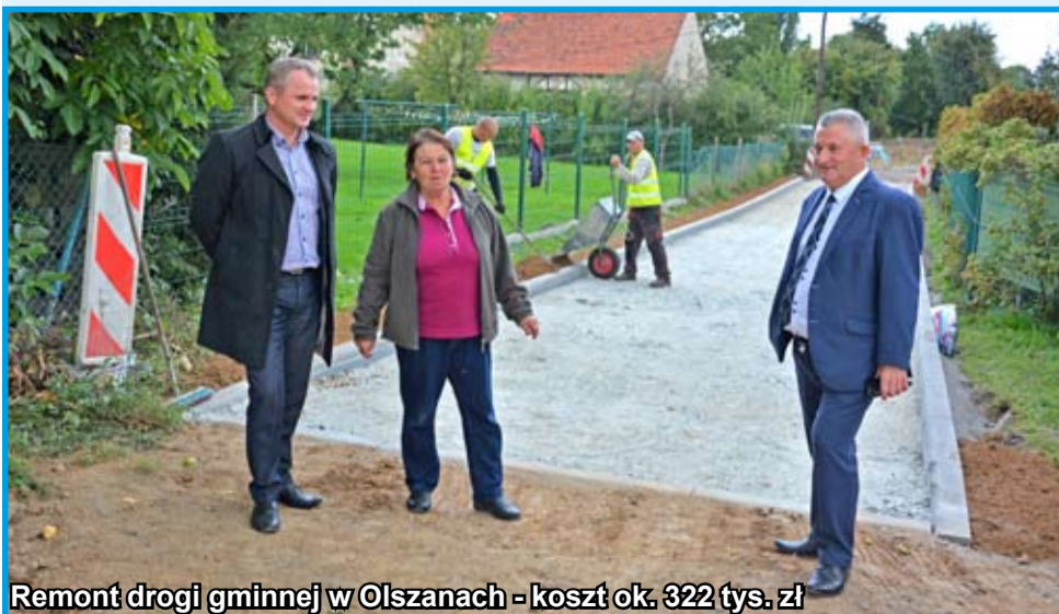
Remont drogi gminnej w Olszanach - koszt ok. 322 tys. zł