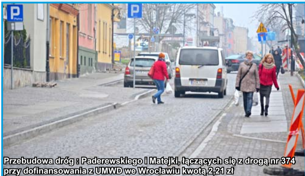
Przebudowa dróg : Paderewskiego i Matejki, łączących się z drogą nr 374 przy dofinansowania z UMWD we Wrocławiu kwotą 2,21 zł