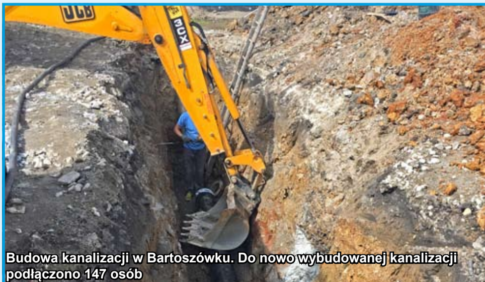
Budowa kanalizacji w Bartoszówku. Do nowo wybudowanej kanalizacji podłączono 147 osób