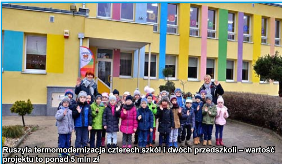
Ruszyła termomodernizacja czterech szkół i dwóch przedszkoli – wartość projektu to ponad 5 mln zł