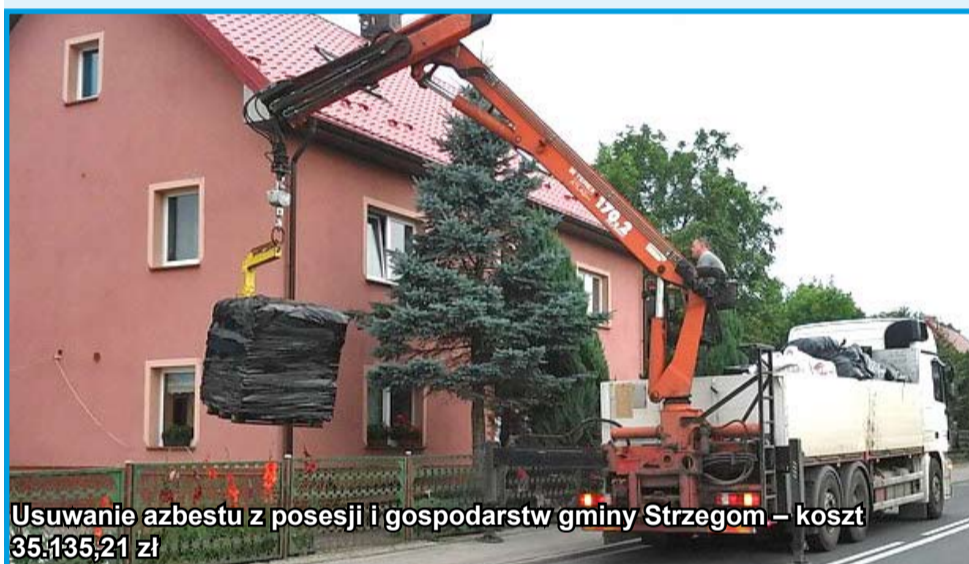
Usuwanie azbestu z posesji i gospodarstw gminy Strzegom – koszt 35.135,21 zł