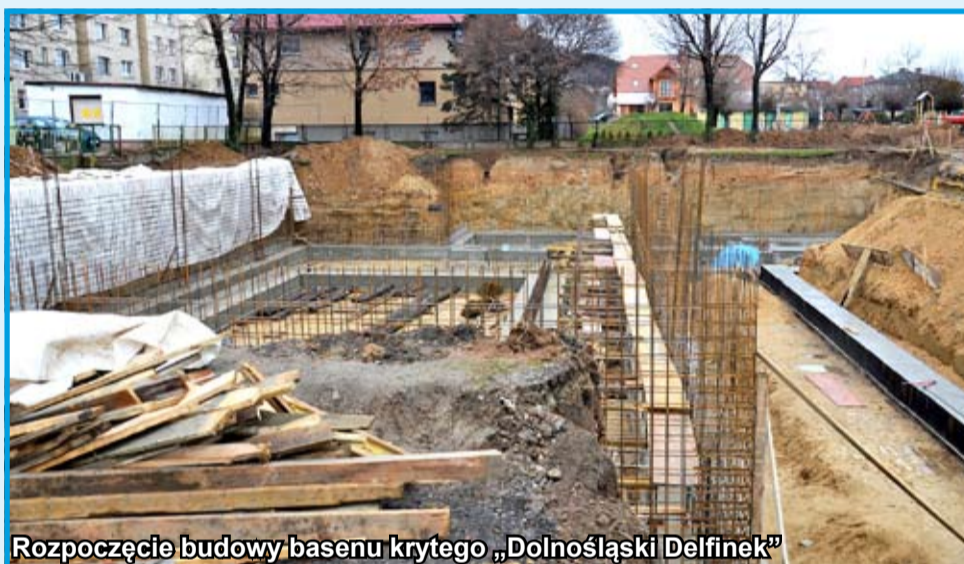
Rozpoczęcie budowy basenu krytego „Dolnośląski Delfinek”