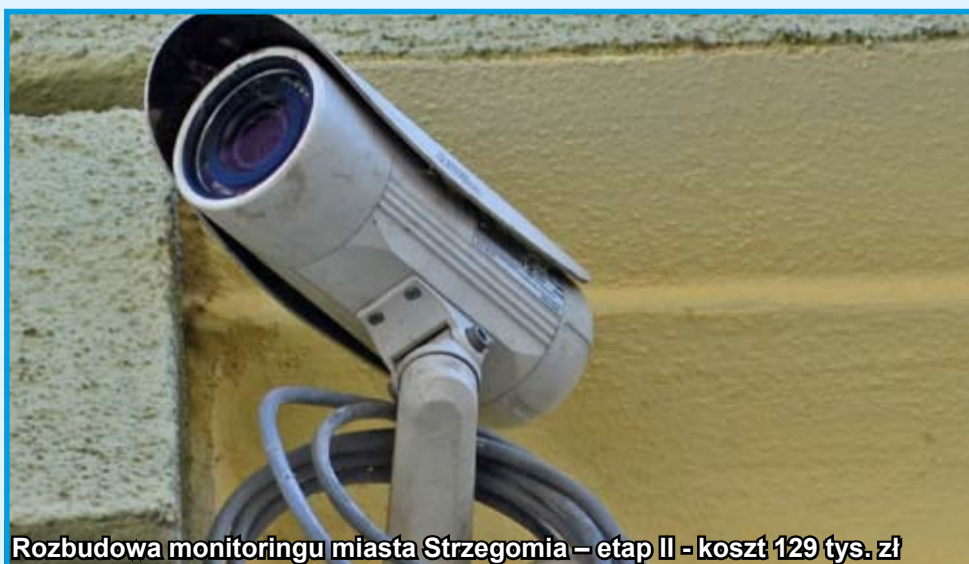
Rozbudowa monitoringu miasta Strzegomia – etap II - koszt 129 tys. zł