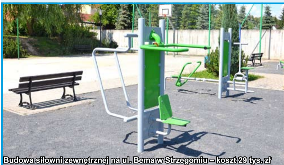
Budowa siłowni zewnętrznej na ul. Bema w Strzegomiu – koszt 29 tys. zł