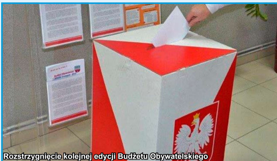
Rozstrzygnięcie kolejnej edycji Budżetu Obywatelskiego