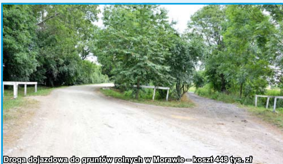
Droga dojazdowa do gruntów rolnych w Morawie – koszt 448 tys. zł