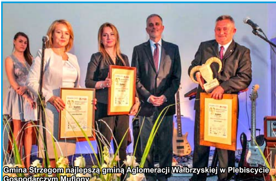
Gmina Strzegom najlepszą gminą Aglomeracji Wałbrzyskiej w Plebiscywie Gospodarczym Muflony