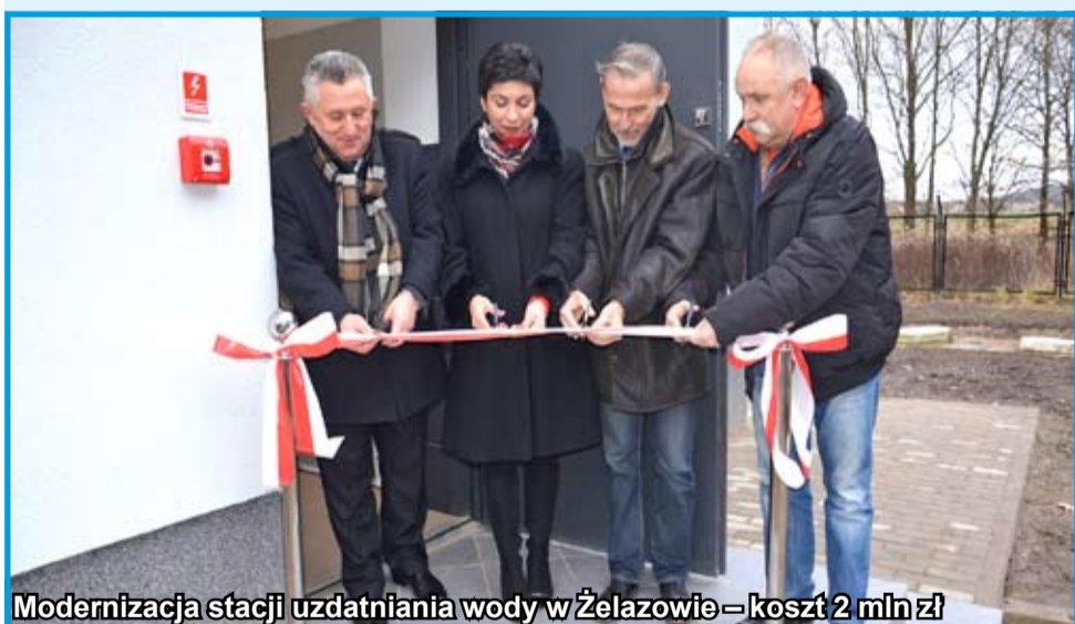
Modernizacja stacji uzdatniania wody w Żelazowie – koszt 2 mln zł