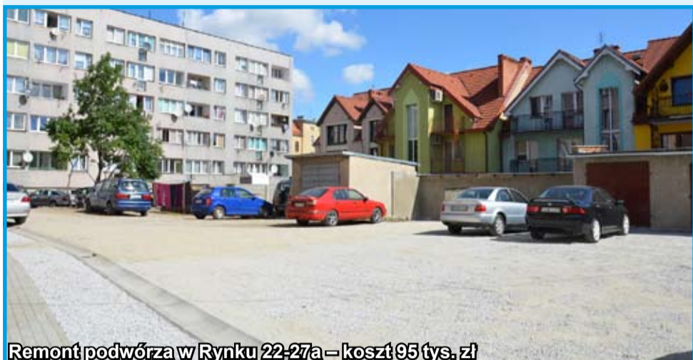
Remont podwórza w Ryńku 22-27a – koszt 95 tys. zł

W poprzednich numerach „Gminnych Wiadomości Strzegom” rozpoczęliśmy cykl podsumowań związany z kończąca się kadencją 2014–2018. W kolejnych wydaniach przypomnimy naszym czytelnikom najważniejsze remonty drogowy, inwestycje zrealizowane w mieście i na terenie sołectw oraz inne dokonania strzegomskiego samorządu, dzięki którym nasza gmina sukcesywnie zmienia swoje oblicze i wizerunek. W tym numerze kontynuujemy 2016 r., w którym na inwestycje przeznaczono ok. 15,4 mln zł. Rok zakończono prawie milionową nadwyżką budżetową. Za dwa tygodnie podsumowanie 2017 r.