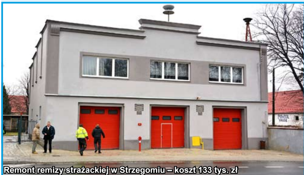
Remont remizy strażackiej w Strzegomiu – koszt 133 tys. zł