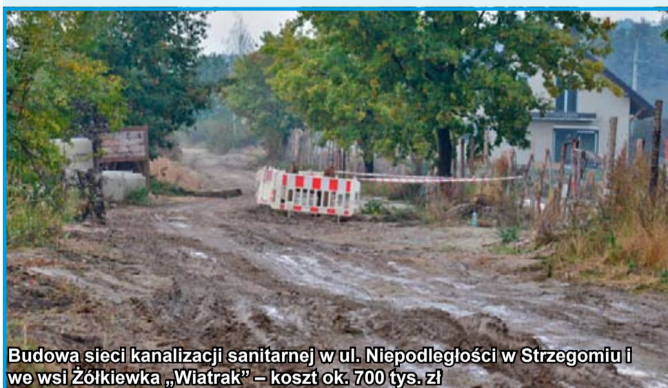
Budowa sieci kanalizacji sanitarnej w ul. Niepodległości w Strzegomiu i we wsi Żółkiewka „Wiatrak” – koszt ok. 700 tys. zł