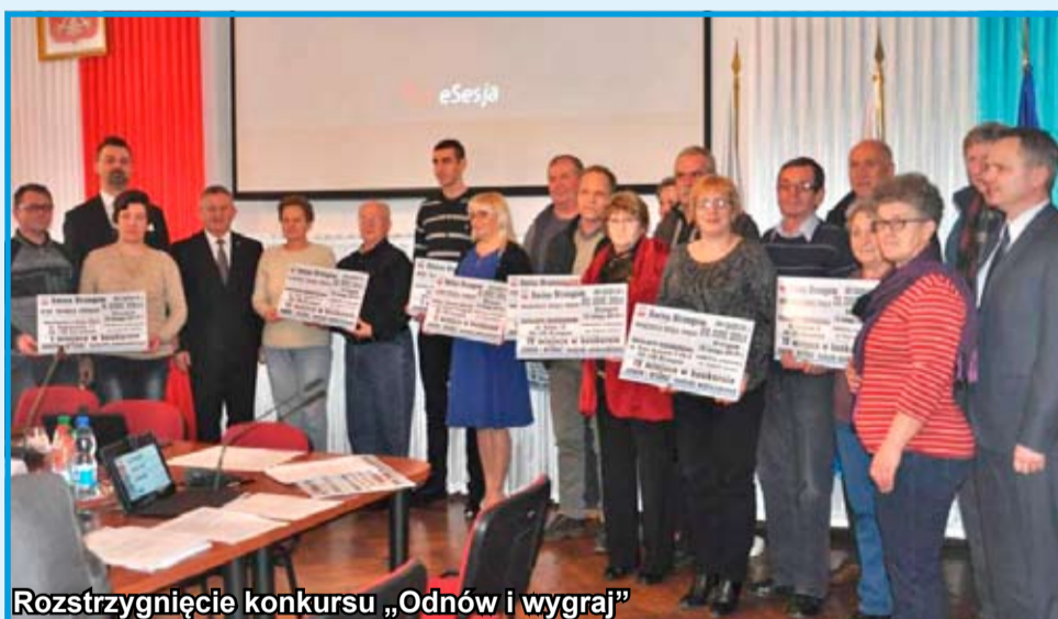
Rozstrzygnięcie konkursu „Odnów i wygraj”