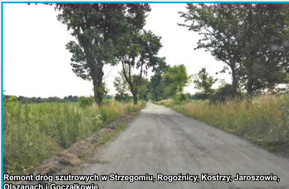
Remont dróg szutrowych w Strzegomiu, Rogoźnicy, Kostrzy, Jaroszowie, Olszanach i Goczałkowie