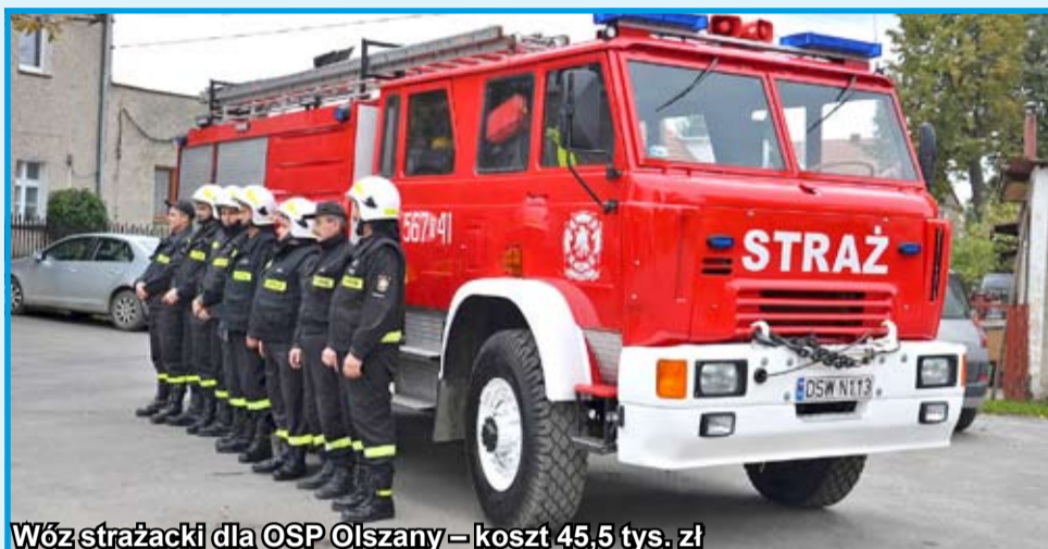
Wóz strażacki dla OSP Olszany – koszt 45,5 tys. zł