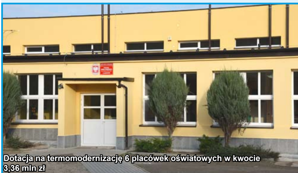
Dotacja na termomodernizację 6 placówek oświatowych w kwocie 3,36 mln zł