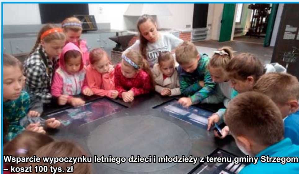
Wsparcie wypoczynku letniego dzieci i młodzieży z terenu gminy Strzegom – koszt 100 tys. zł