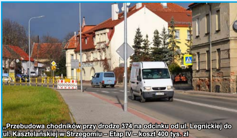
„Przebudowa chodników przy drodze 374 na odcinku od ul. Legnickiej do ul. Kasztelańskiej w Strzegomiu – Etap IV – koszt 400 tys. zł