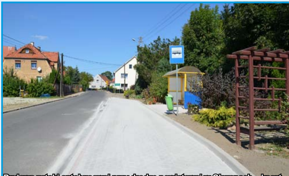
Budowa zatoki autobusowej przy drodze powiatowej w Olszanach – koszt 20 tys. zł