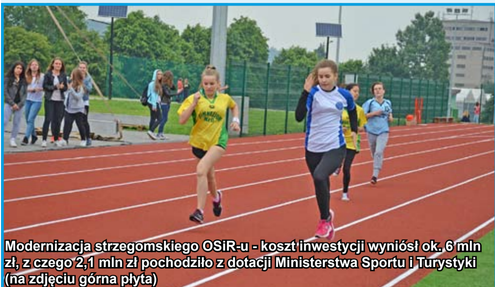
Modernizacja strzegomskiego OSiR-u - koszt inwestycji wyniósł ok. 6 mln zł, z czego 2,1 mln zł pochodziło z dotacji Ministerstwa Sportu i Turystyki (na zdjęciu górna płyta)