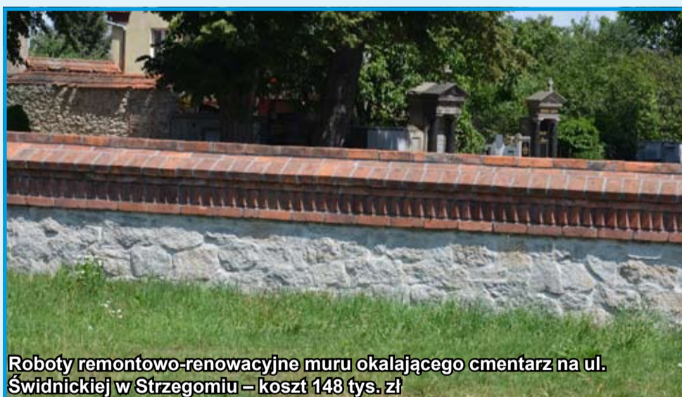
Roboty remontowo-renowacyjne muru okalającego cmentarz na ul. Świdnickiej w Strzegomiu – koszt 148 tys. zł