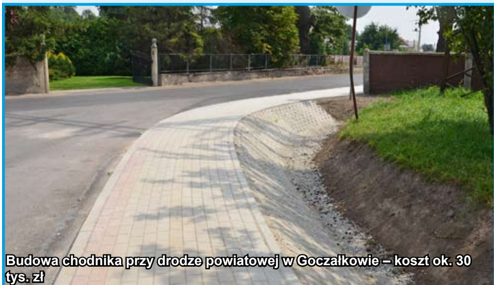
Budowa chodnika przy drodze powiatowej w Goczałkowie – koszt ok. 30 tys. zł