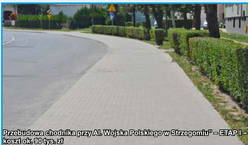
Przebudowa chodnika przy Al. Wojska Polskiego w Strzegomiu” – ETAP I – koszt ok. 90 tys. zł