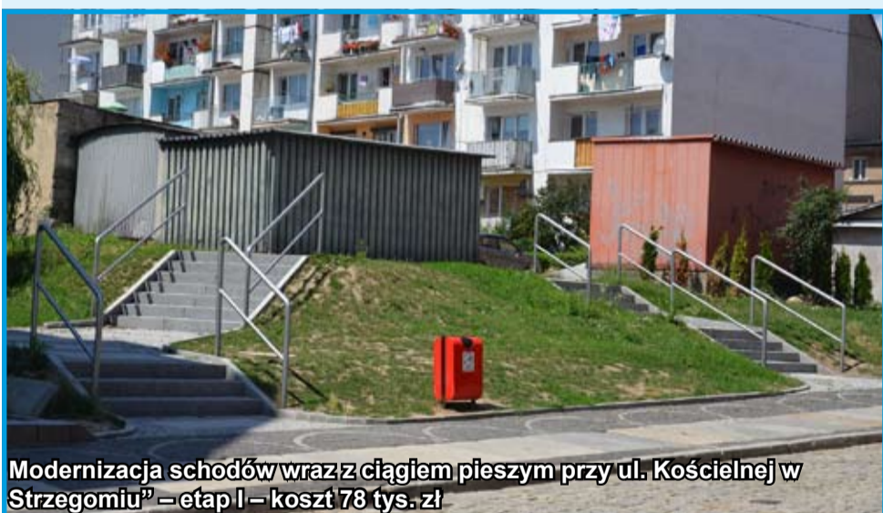
Modernizacja schodów wraz z ciągiem pieszym przy ul. Kościelnej w Strzegomiu – etap I – koszt 78 tys. zł