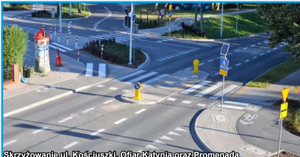
Skrzyżowanie ul. Kościuszki, Ofiar Katynia oraz Promenada