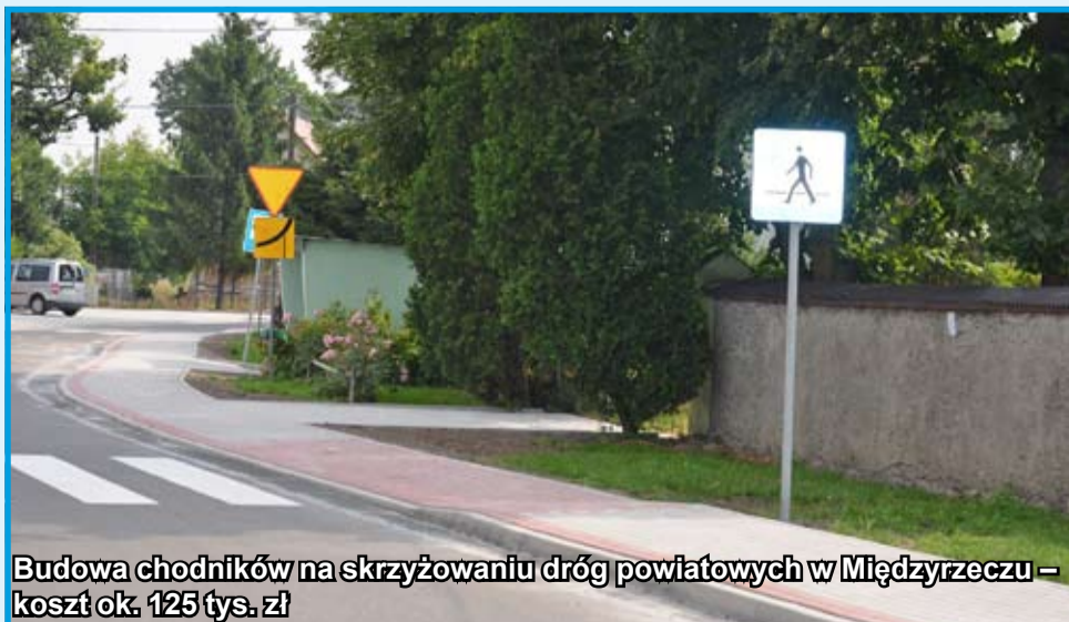
Budowa chodników na skrzyżowaniu dróg powiatowych w Międzyrzeczu – koszt ok. 125 tys. zł