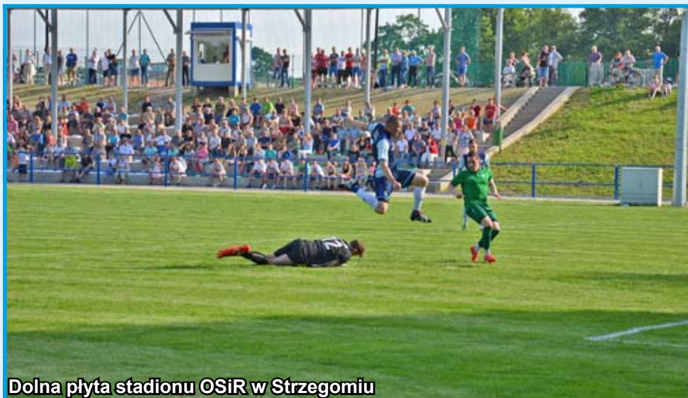
Dolna płyta stadionu OSiR w Strzegomiu