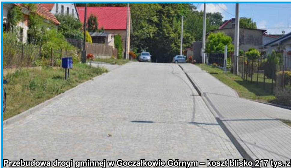
Przebudowa drogi gminnej w Goczałkowie Górnym – koszt blisko 217 tys. zł