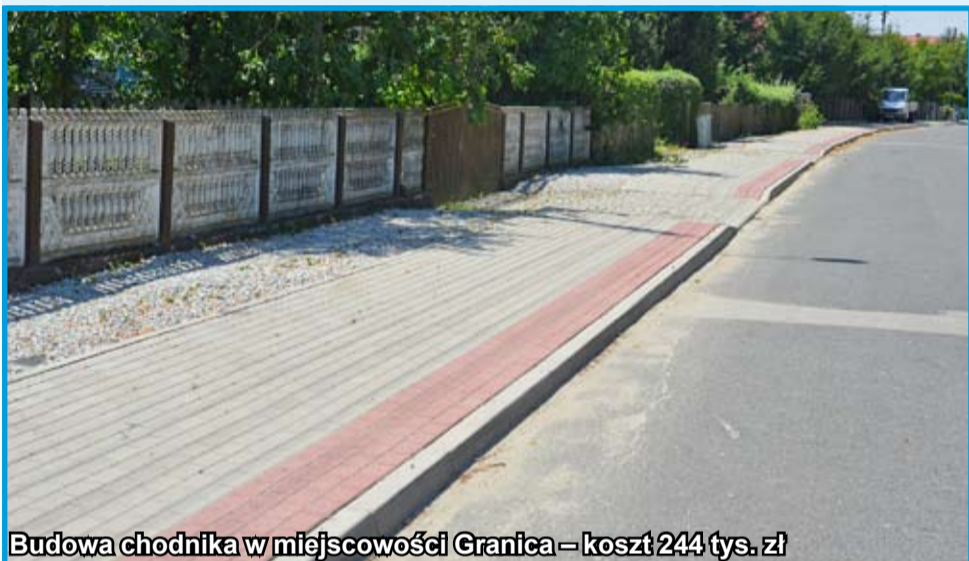
Budowa chodnika w miejscowości Granica – koszt 244 tys. zł