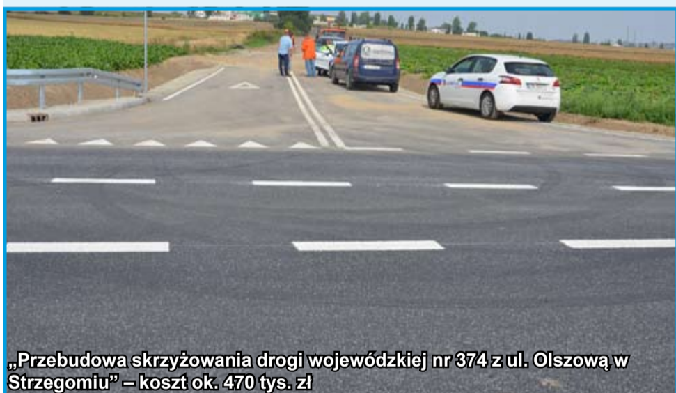
„Przebudowa skrzyżowania drogi wojewódzkiej nr 374 z ul. Olszową w Strzegomiu” – koszt ok. 470 tys. zł