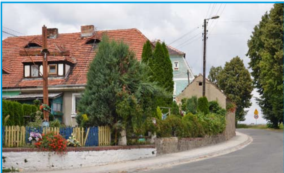
Budowa chodnika przy drodze powiatowej w Skarżycach – koszt 35,6 tys. zł