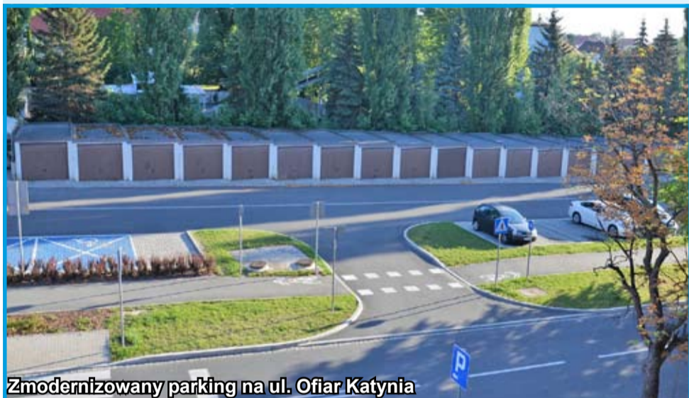
Zmodernizowany parking na ul. Ofiar Katynia