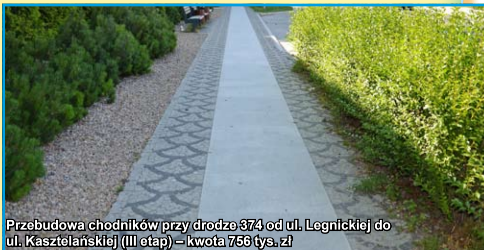
Przebudowa chodników przy drodze 374 od ul. Legnickiej do ul. Kasztelańskiej (III etap) – kwota 756 tys. zł