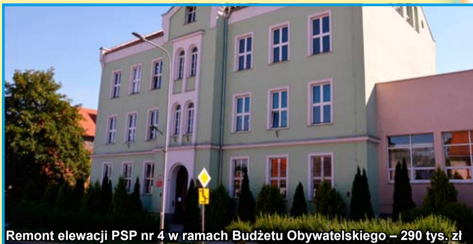
Remont elewacji PSP nr 4 w ramach Budżetu Obywatelskiego – 290 tys. zł