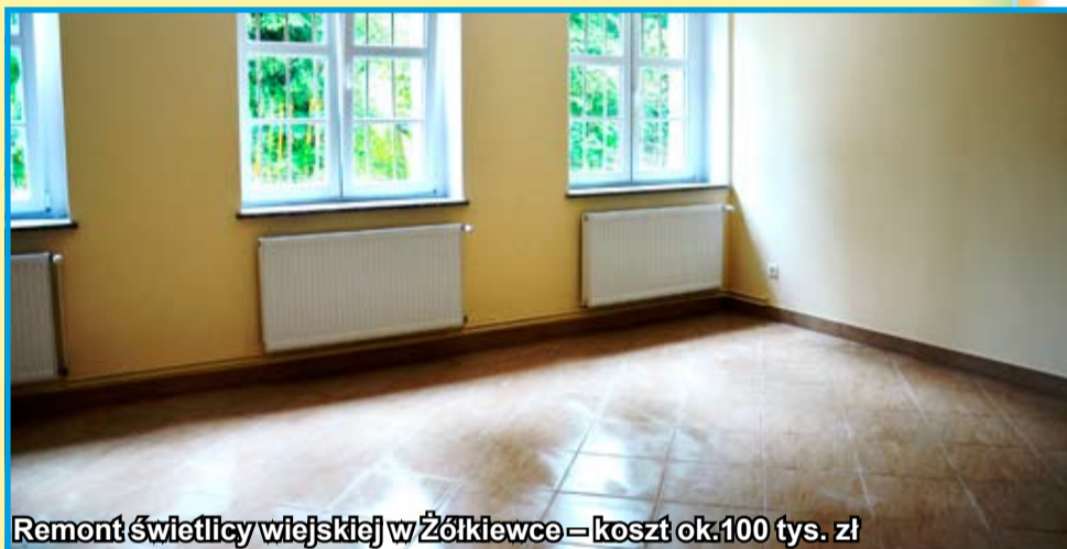
Remont świetlicy wiejskiej w Żółkiewce – koszt ok. 100 tys. zł