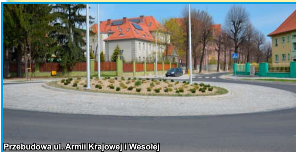
Przebudowa ul. Armii Krajowej i Wesołej