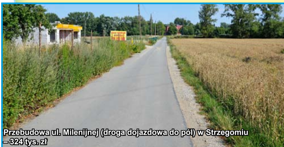
Przebudowa ul. Milenijnej (droga dojazdowa do pól) w Strzegomiu – 324 tys. zł