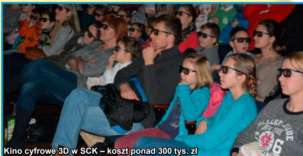
Kino cyfrowe 3D w SCK – koszt ponad 300 tys. zł

Gmina Strzegom partycypowała w kosztach budowy nowej siedziby Pogotowia Ratunkowego w Świdnicy. Przekazała ze swojego budżetu na ten cel kwotę 215 tys. zł.