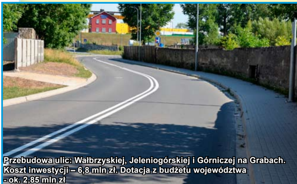
Przebudowa ulic: Wałbrzyskiej, Jeleniogórskiej i Górniczej na Grabach. Koszt inwestycji – 6,8 mln zł. Dotacja z budżetu województwa – ok. 2,85 mln zł

Od tego numeru „Gminnych Wiadomości Strzegom” rozpoczynamy cykl podsumowań związany z kończącą się kadencją 2014-2018. W kolejnych wydaniach przypomnimy naszym czytelnikom najważniejsze remonty drogowy, inwestycje zrealizowane w mieście i na terenie sołectw, dzięki którym nasza gmina sukcesywnie zmienia swoje oblicze i wizerunek. W tym numerze 2015 r., w którym na inwestycje przeznaczono blisko 16 mln zł, z czego ok. 8 mln zł to pozyskane dotacje. Rok zakończono nadwyżką budżetową.