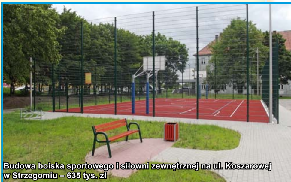
Budowa boiska sportowego i siłowni zewnętrznej na ul. Koszarowej w Strzegomiu – 635 tys. zł