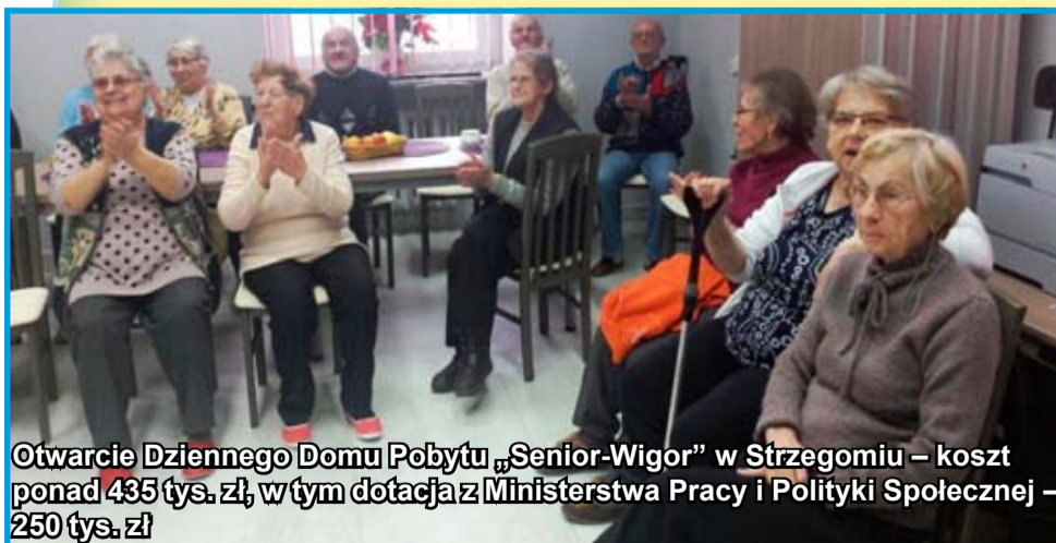
Otwarcie Dziennego Domu Pobytu „Senior-Wigor” w Strzegomiu – koszt ponad 435 tys. zł, w tym dotacja z Ministerstwa Pracy i Polityki Społecznej – 250 tys. zł