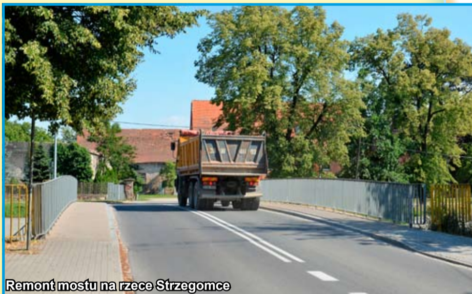
Remont mostu na rzece Strzegomce