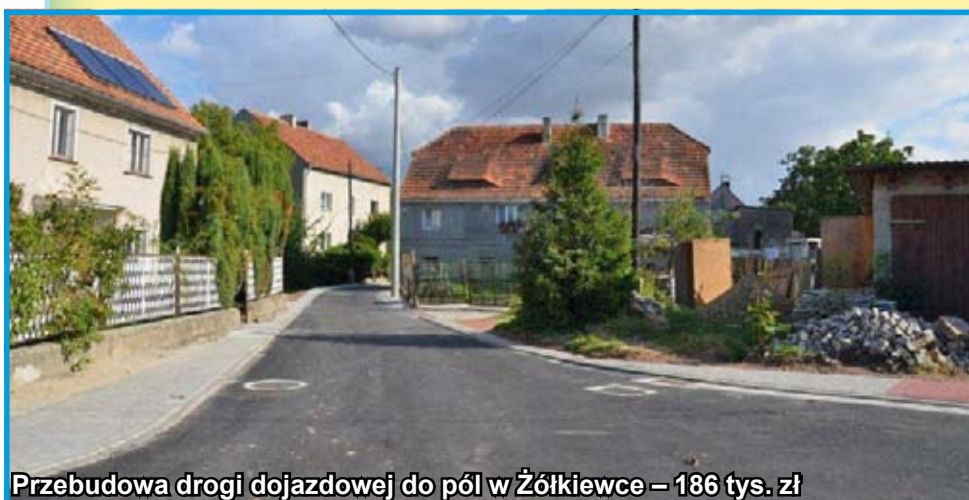
Przebudowa drogi dojazdowej do pól w Żółkiewce – 186 tys. zł