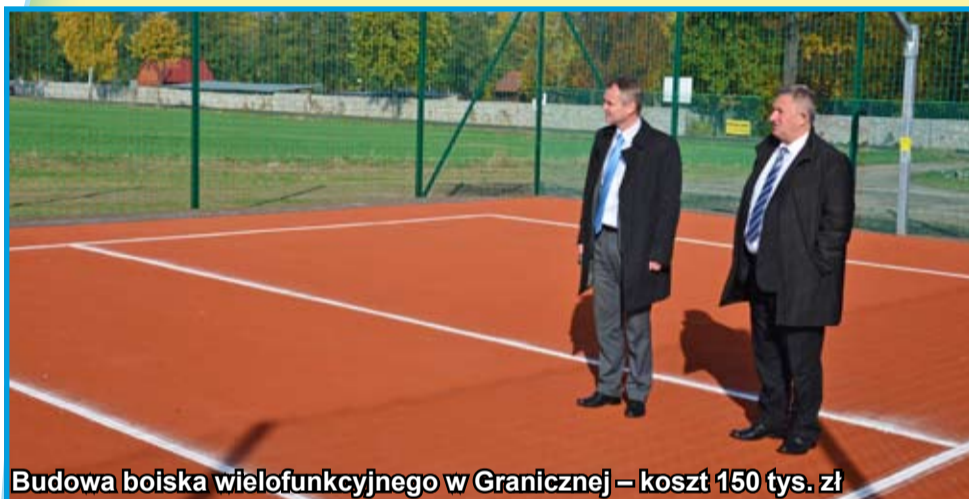
Budowa boiska wielofunkcyjnego w Granicznej – koszt 150 tys. zł