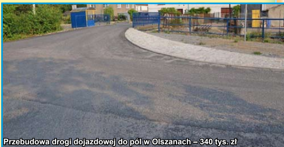
Przebudowa drogi dojazdowej do pól w Olszanach – 340 tys. zł