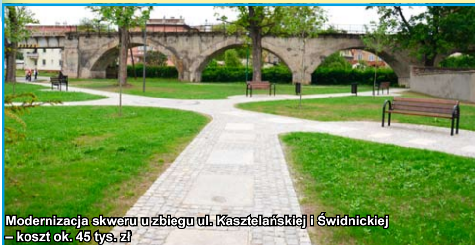
Modernizacja skweru u zbiegu ul. Kasztelańskiej i Świdnickiej – koszt ok. 45 tys. zł