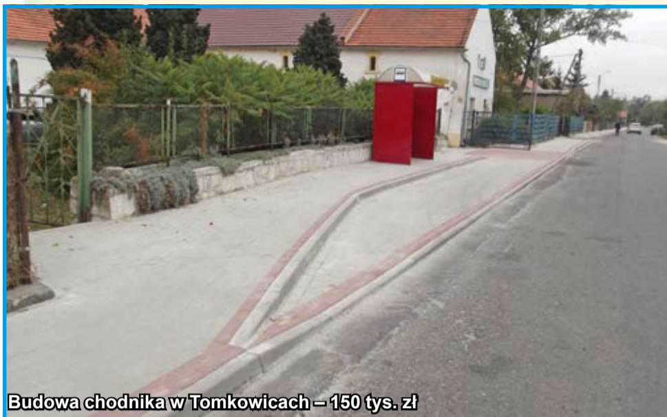
Budowa chodnika w Tomkowicach – 150 tys. zł