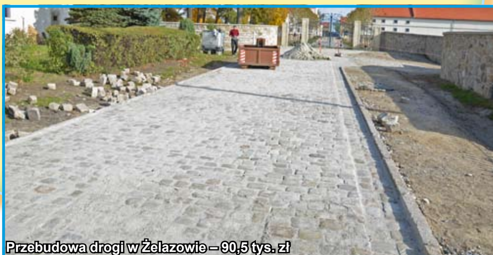
Przebudowa drogi w Żelazowie – 90,5 tys. zł