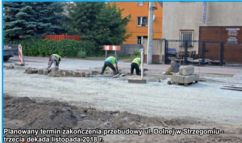
Planowany termin zakończenia przebudowy ul. Dolnej w Strzegomiu - trzecia dekada listopada 2018 r.