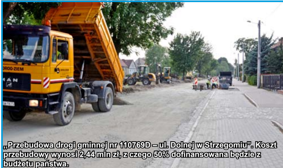
„Przebudowa drogi gminnej nr 110769D – ul. Dolnej w Strzegomiu”. Koszt przebudowy wynosi 2,44 mln zł, z czego 50% dofinansowana będzie z budżetu państwa.

Aktualnie w Strzegomiu i na terenie sołectw naszej gminy realizowanych jest wiele inwestycji drogowych, które zdecydowanie poprawią bezpieczeństwo mieszkańców i kierowców. W tym numerze krótki raport drogowy. Zapraszamy do zapoznania się z nim.