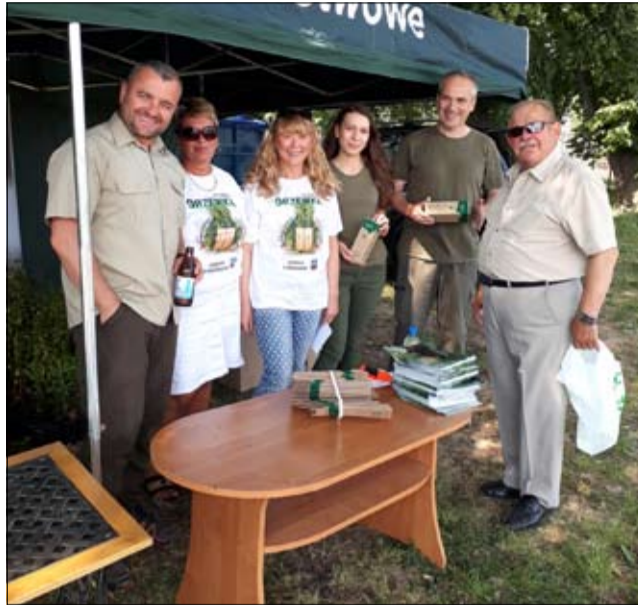
kujemy za udział w naszej akcji wszystkim mieszkańcom oraz Nadleśnictwu Jawor, firmie ENERIS Ochrona Środowiska i ZUK w Strzegomiu.

temat przyrody i krajobrazu otaczającego nas środowiska rozdając ciekawe informatory. Dużym powodzeniem cieszyła się również bramka do gry przygotowana przez firmę ENERIS Ochrona Środowiska, gdzie dzieci z rodzicami uczyli się do jakiego pojemnika wrzucać wybrane frakcje odpadów. Dzieci w zamian za udział w grze otrzymywały książeczki do kolorowania. Pracownicy ZUK sprawnie wazyli, zapisywali masę i rodzaj zebranych odpadów i umieszczali je w specjalnie przygotowanych kontenerach. Mieszkańcy odchodzili z sadzonkami zadowoleni. Dzięki