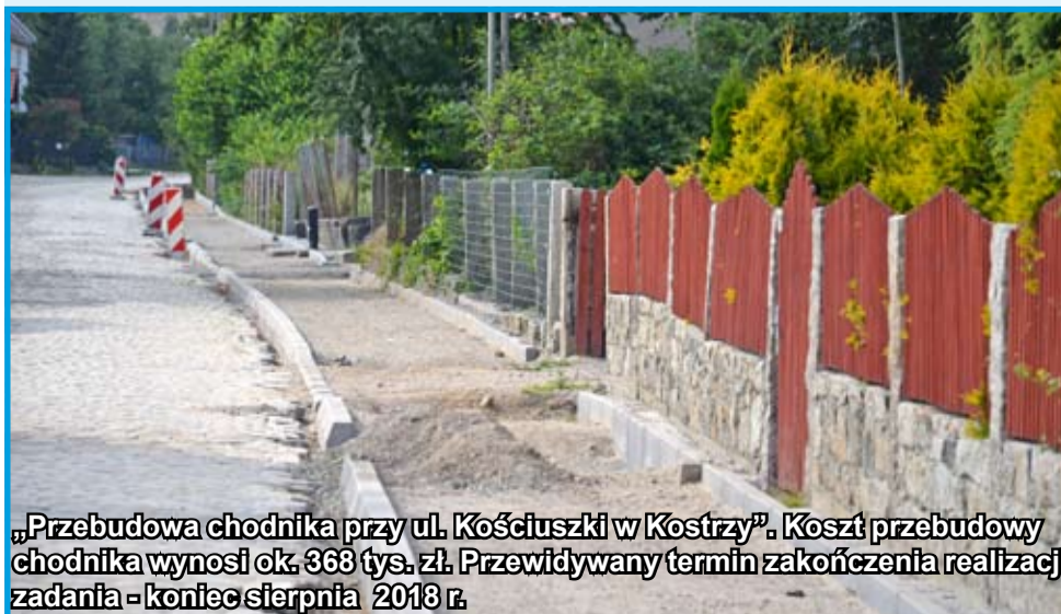
„Przebudowa chodnika przy ul. Kościuszki w Kostrzy”. Koszt przebudowy chodnika wynosi ok. 368 tys. zł. Przewidywany termin zakończenia realizacji zadania - koniec sierpnia 2018 r.