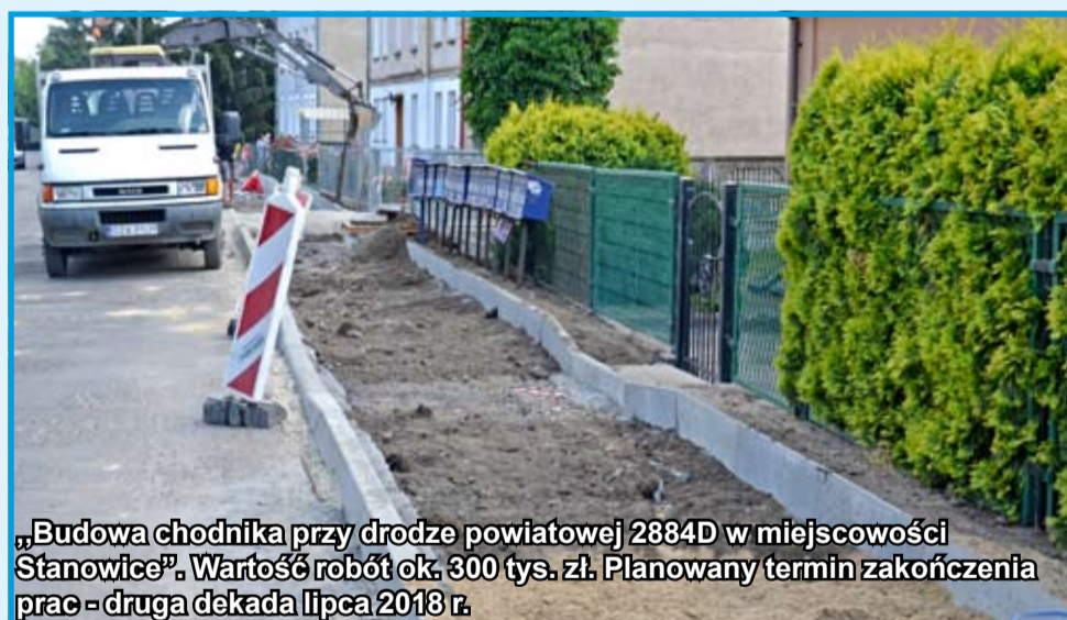
„Budowa chodnika przy drodze powiatowej 2884D w miejscowości Stanowice”. Wartość robót ok. 300 tys. zł. Planowany termin zakończenia prac - druga dekada lipca 2018 r.