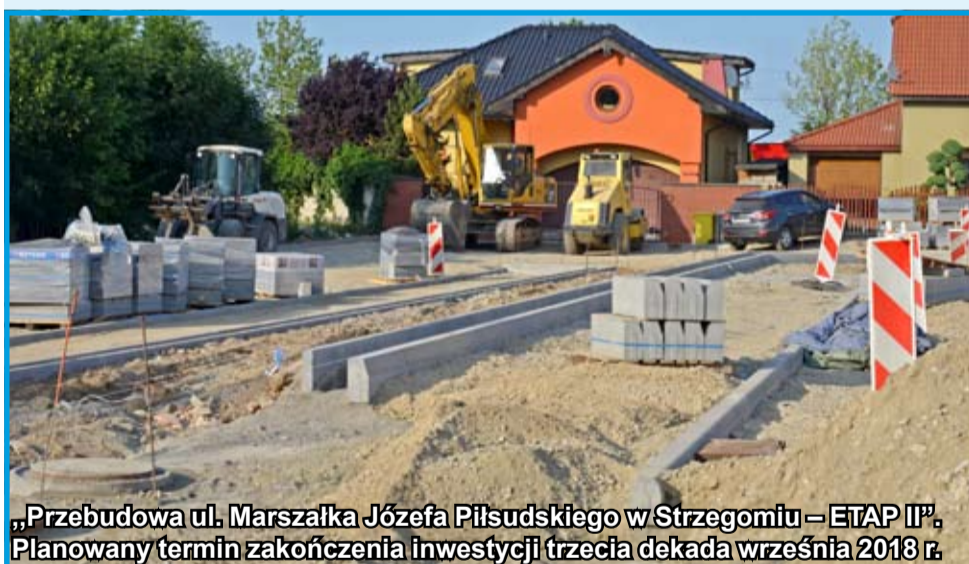
„Przebudowa ul. Marszałka Józefa Piłsudskiego w Strzegomiu – ETAP II”. Planowany termin zakończenia inwestycji trzecia dekada września 2018 r.