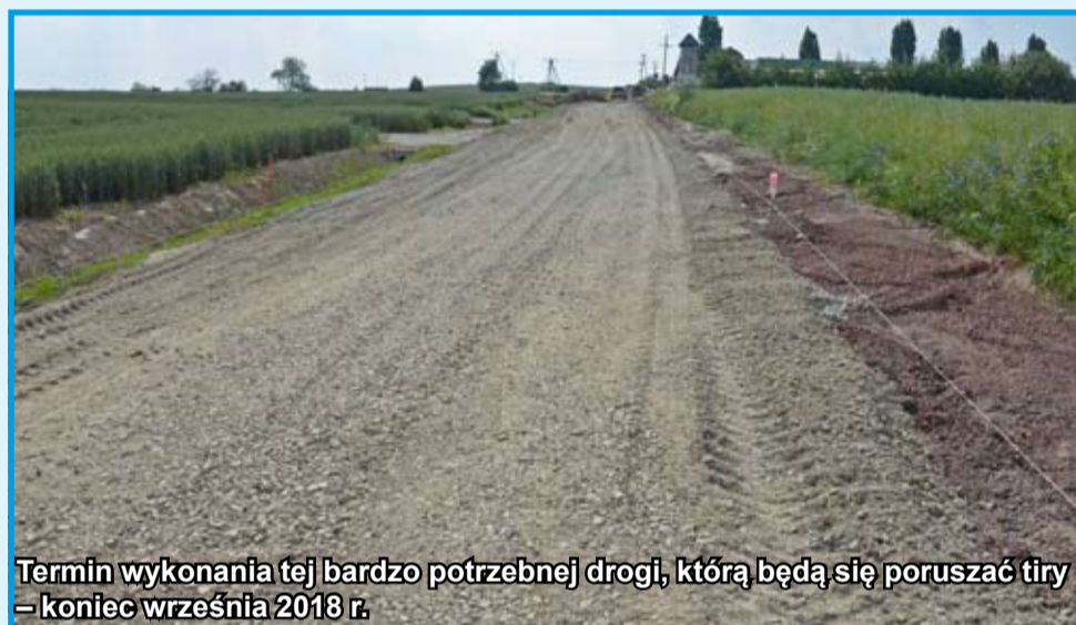
Termin wykonania tej bardzo potrzebnej drogi, którą będą się poruszać tiry – koniec września 2018 r.