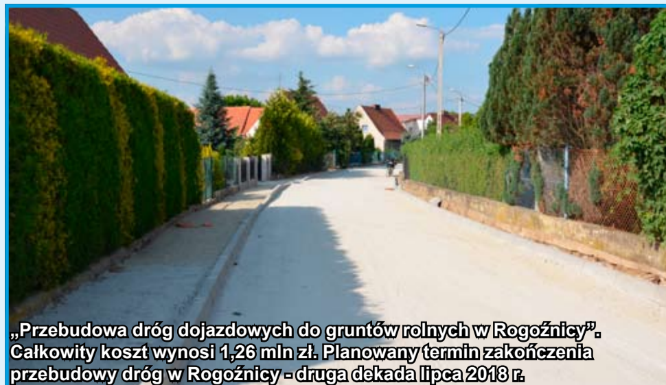
„Przebudowa dróg dojazdowych do gruntów rolnych w Rogoźnicy”. Całkowity koszt wynosi 1,26 mln zł. Planowany termin zakończenia przebudowy dróg w Rogoźnicy - druga dekada lipca 2018 r.