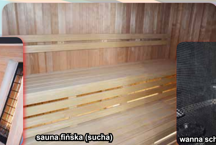
sauna fińska (sucha)