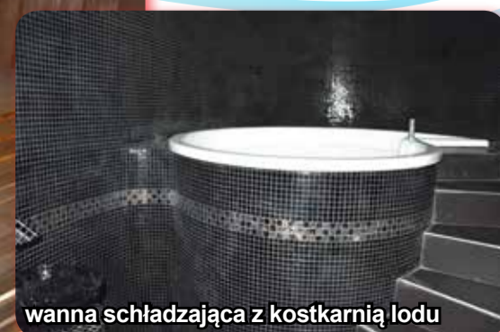
wanna schładzająca z kostkarnią lodu