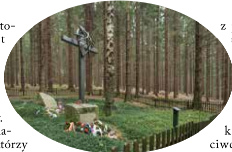
Gross-Rosen i Flossenbürg stali się ich ofiarami. Jedna

Na wystawie zaprezentowano 18 miejsc – miast i wsi na terytorium Czech – gdzie w czasie II wojny światowej Niemcy utworzyli obozy pracy przymusowej dla Żydów, Romów i Polaków. Ekspozycja ukazuje dramatyczny los robotników, którzy w 1944 r. w wyniku przejęcia części obozów pracy przymusowej przez komendatury KL