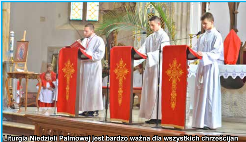
Liturgia Niedzieli Palmowej jest bardzo ważna dla wszystkich chrześcijan