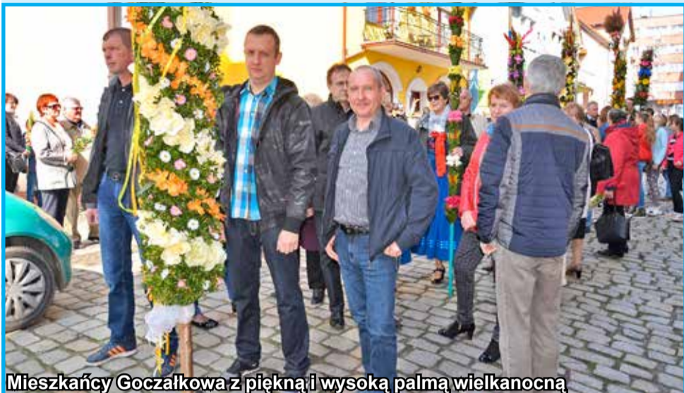
Mieszkańcy Goczałkowa z piękną i wysoką palmą wielkanocną

Jarmark Wielkanocny to uczta zarówno dla ciała, jaki i dla duszy. W pierwszej części uroczystości uczestnicy strzegomskiego jarmarku wzięli udział w pięknych i niezwykle ważnych obrzędach związanych z obchodami Niedzieli Palmowej, w drugiej - w barwnym kiermaszu i wystawie stroików, palm i ozdób świątecznych. Nie obyło się również bez występów artystycznych. Serdecznie zapraszamy do obejrzenia fotoreportażu.