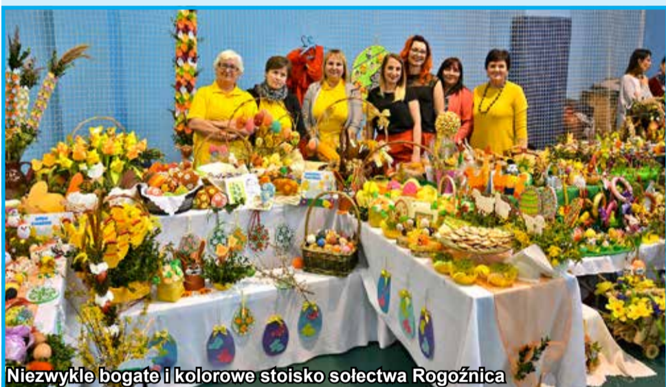
Niezwykle bogate i kolorowe stoisko sołectwa Rogoźnica