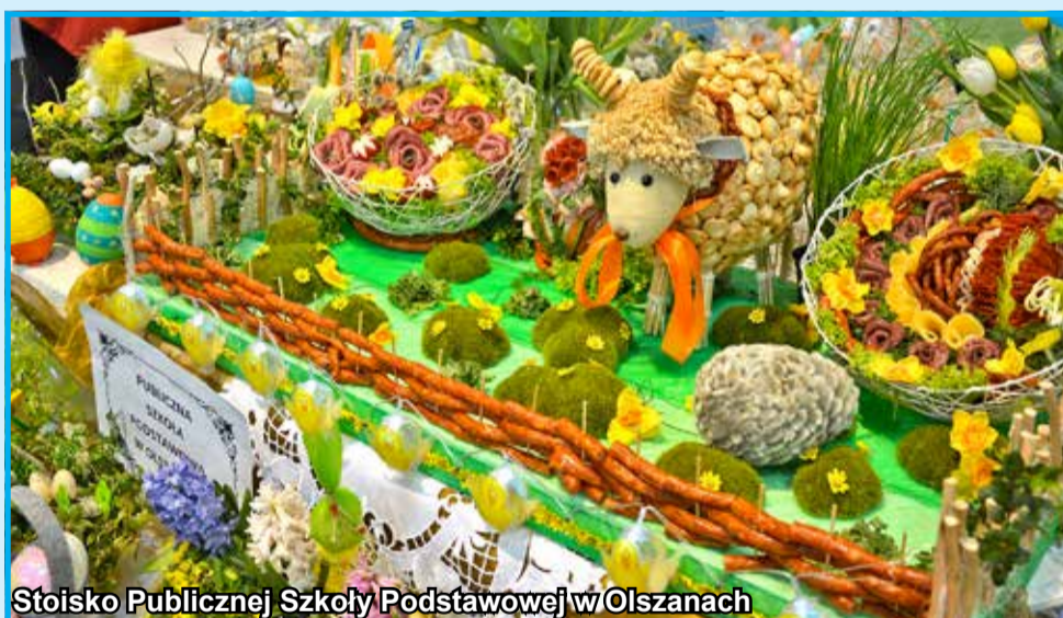
Stoisko Publicznej Szkoły Podstawowej w Olszanach