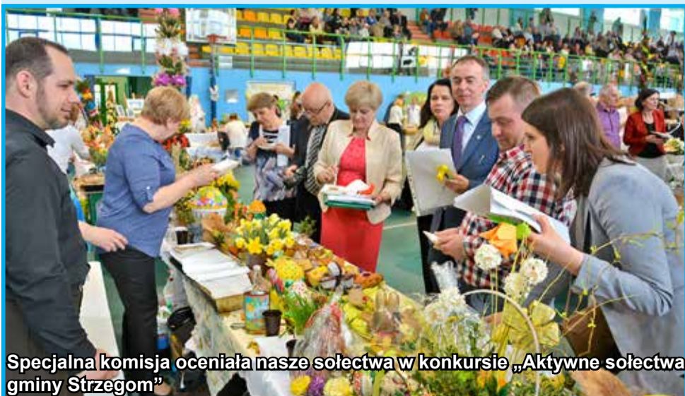
Specjalna komisja oceniała nasze sołectwa w konkursie „Aktywne sołectwa gminy Strzegom”