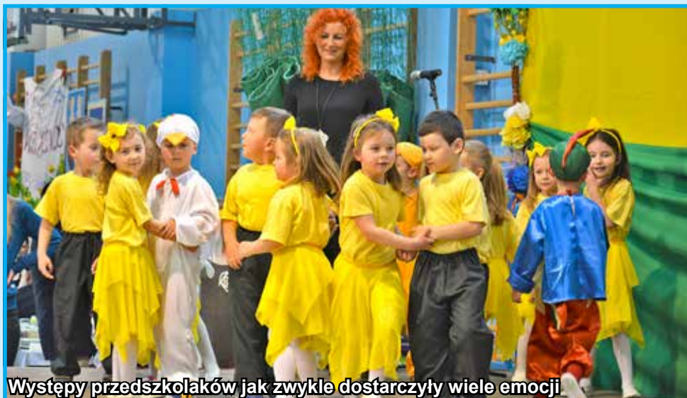
Występy przedszkolaków jak zwykle dostarczyły wiele emocji