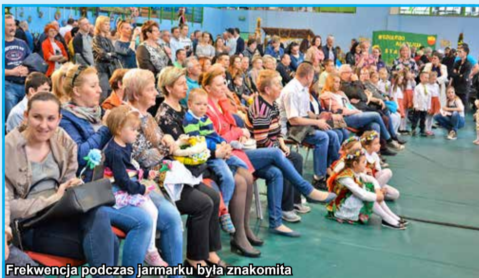
Frekwencja podczas jarmarku była znakomita