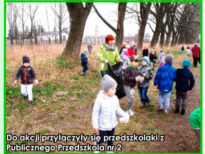
Do akcji przyłączyli się przedszkolaki z Publicznego Przedszkola nr 2