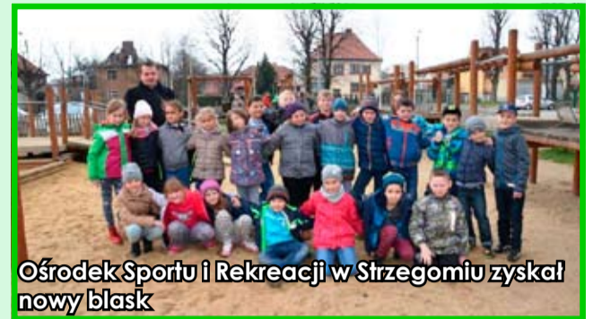
Ośrodek Sportu i Rekreacji w Strzegomiu zyskał nowy blask