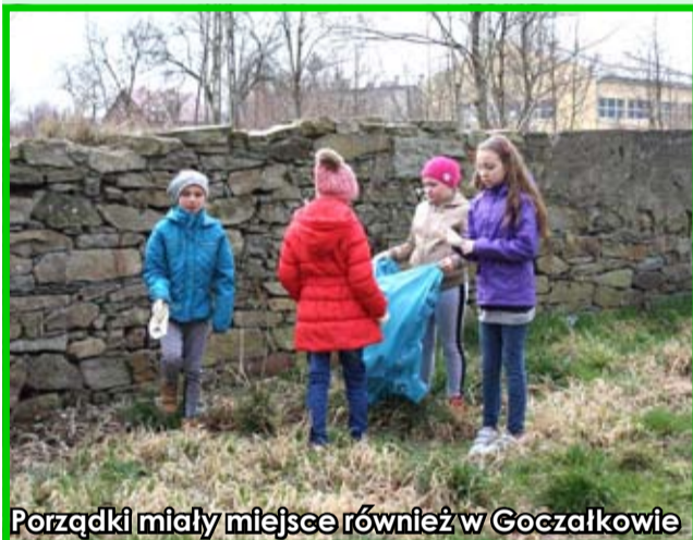
Porządki miały miejsce również w Goczałkowie