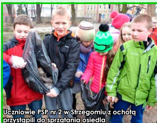
Uczniowie PSP nr 2 w Strzegomiu z ochotą przystąpili do sprzątania osiedla