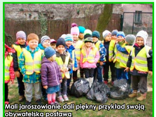
Mali jaroszwianie dali piękny przykład swoją obywatelską postawą