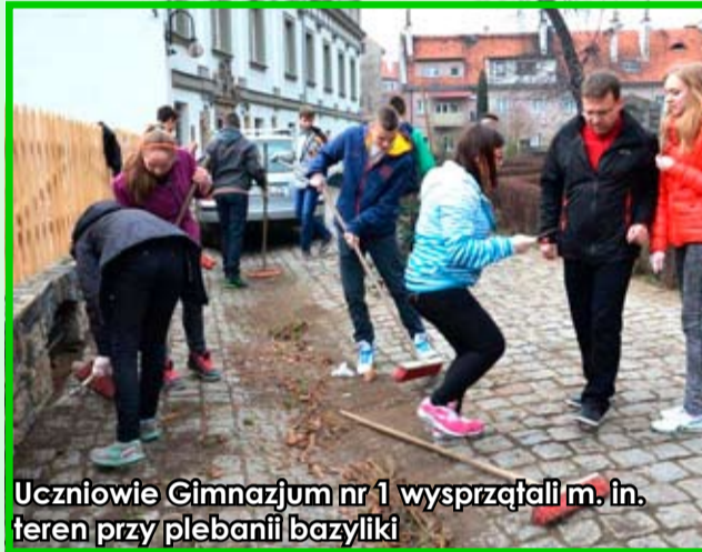
Uczniowie Gimnazjum nr 1 wysprzątali m. in. teren przy plebanii bazyliki