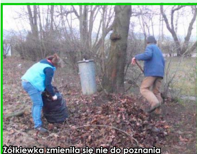
Żółkiewka zmieniła się nie do poznania