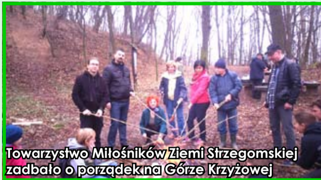
Towarzystwo Miłośników Ziemi Strzegomskiej zadbało o porządek na Górze Krzyżowej

Zakrojona na dużą skalę akcja sprzątania naszej gminy za nami. Mieszkańcy Strzegomia i okolicznych wsi zdali egzamin „na szóstkę” i pokazali, że wspólnymi siłami można dokonać naprawdę coś pożytecznego. W ciągu trzech dni (od 26-28 marca br.) młodzi i starsi posprzątali parki, tereny wokół szkół, okoliczne osiedla, place zabaw, skwery i przystanki autobusowe. Dzięki temu gmina zmieniła się nie do poznania i odzyskała dawno niewidziany blask. Mijmy nadzieję, że powodzenie tegorocznej akcji sprawi, że w kolejnych latach jeszcze chętniej i w większej liczbie przystąpimy do sprzątania naszego najbliższego otoczenia. Jeszcze raz serdecznie dziękujemy!