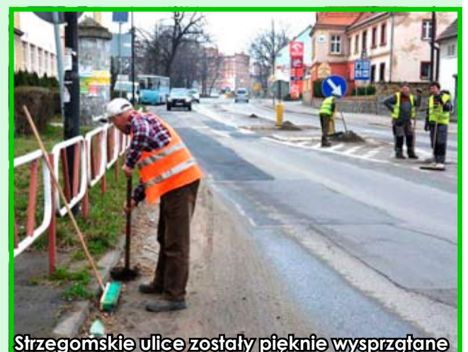
Strzegomskie ulice zostały pięknie wysprzątane