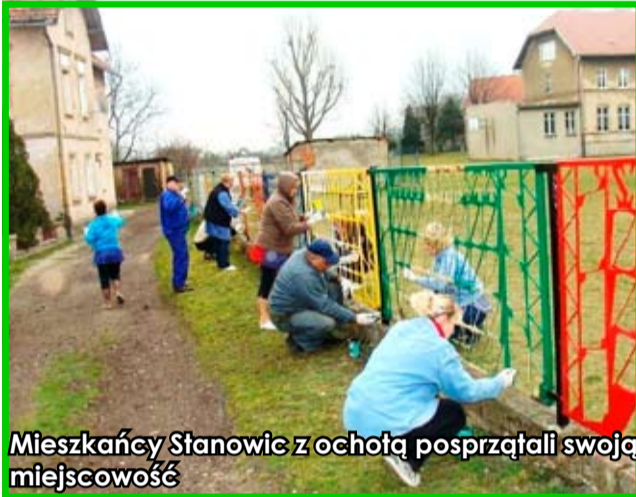
Mieszkańcy Stanowic z ochotą posprzątali swoją miejscowość