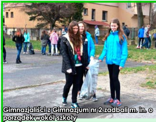
Gimnazjaliści z Gimnazjum nr 2 zadbałi m. in. o porządek wokół szkoły