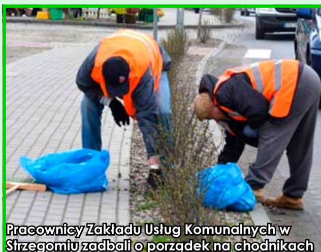
Pracownicy Zakładu Usług Komunalnych w Strzegomiu zadbałi o porządek na chodnikach