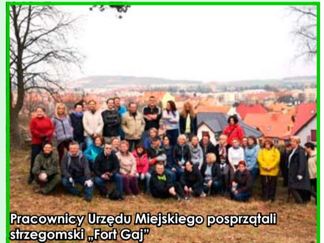
Pracownicy Urzędu Miejskiego posprzątali strzegomski „Fort Gaj”