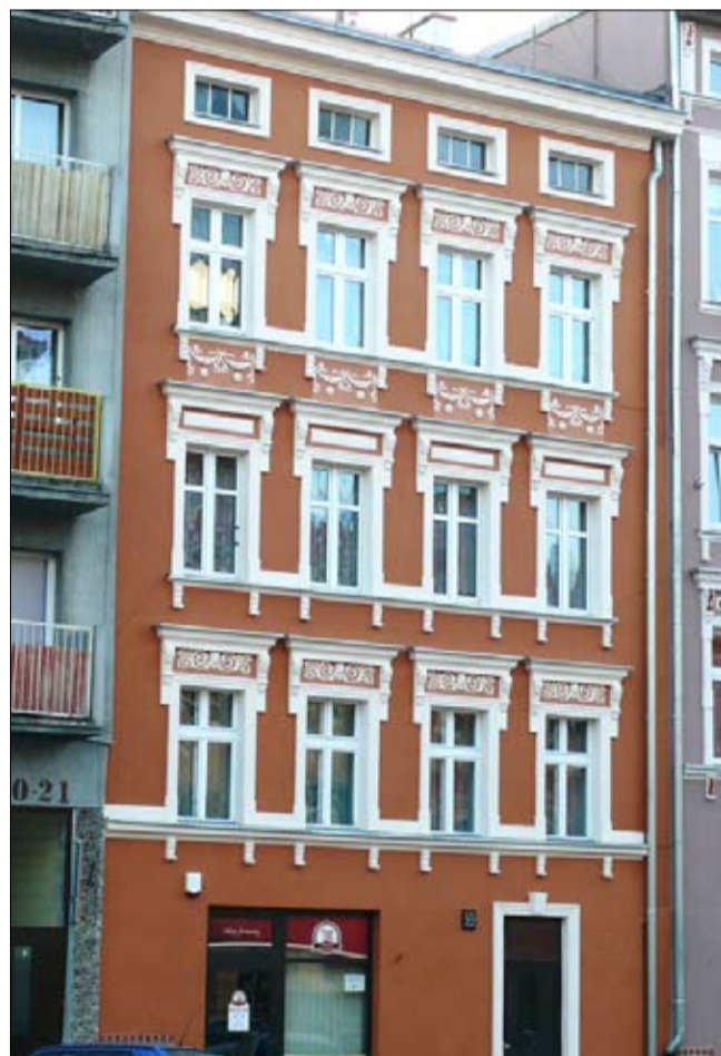
Kamienica Rynek 22, która zwyciężyła w ostatniej edycji konkursu.

Do konkursu można zgłaszać przedsięwzięcia, które rozpoczęły się 1 listopada 2013 roku, a zakończyły przed upływem terminu 30 listopada 2014 r. Zgłoszenia do konkursu należy składać do 6 grudnia br., w siedzibie Urzędu Miejskiego w Strzegomiu, z dopiskiem na kopercie „Konkurs - Odnów i Wygraj!”.