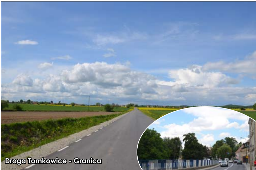
Droga Tomkowice - Granica