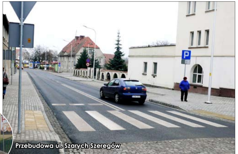
Przebudowa ul. Szarych Szeregów