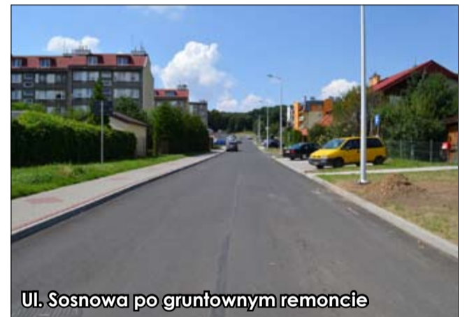
Ul. Sosnowa po gruntownym remoncie

W ciągu czterech lat z budżetu gminy Strzegom przeznaczono 80 mln zł na inwestycje. Wszystkie podejmowane działania miały na celu dobro ludzi, ponieważ najważniejszą inwestycją jest ta w człowieka, w jego edukację, wychowanie, lepsze życie, spokojniejszy i bardziej komfortowy wypoczynek.