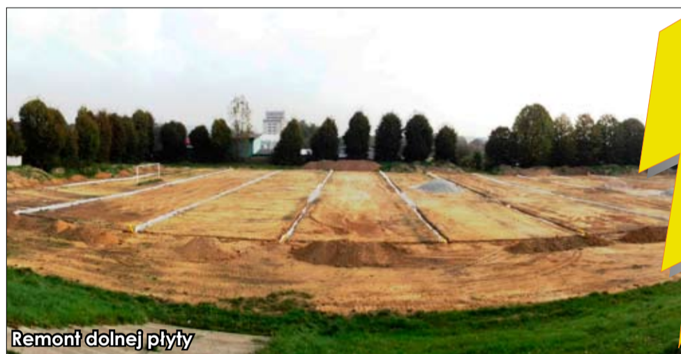
Remont dolnej płyty