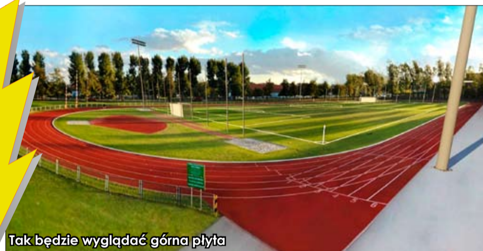
Tak będzie wyglądać górna płyta