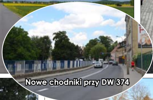
Nowe chodniki przy DW 374