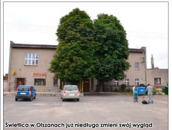
Świetlica w Olszanach już niedługo zmieni swój wygląd.