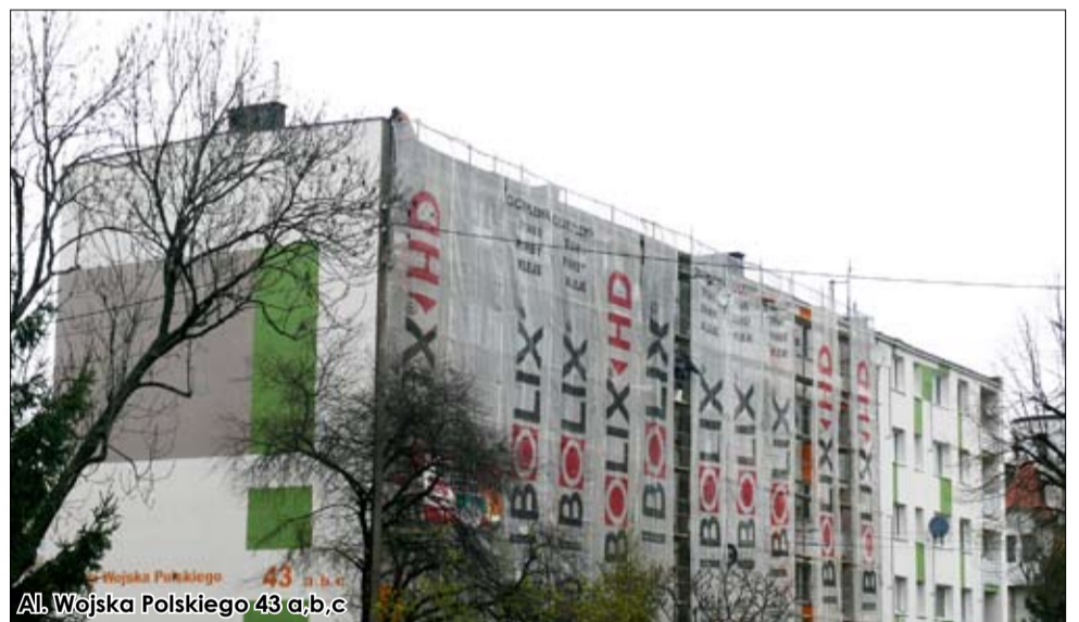
Al. Wojska Polskiego 43 a,b,c