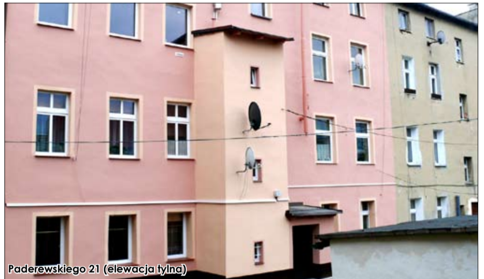
Paderewskiego 21 (elewacja tylna)