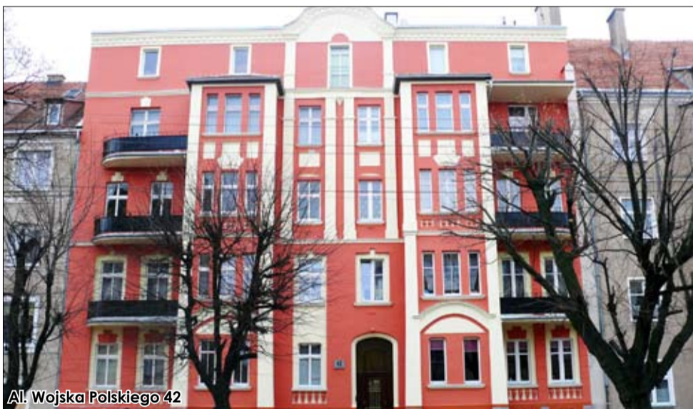
Al. Wojska Polskiego 42