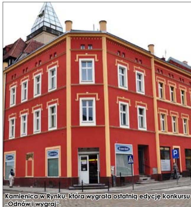
Kamienica w Rynku, która wygrała ostatnią edycję konkursu „Odnów i wygraj”.