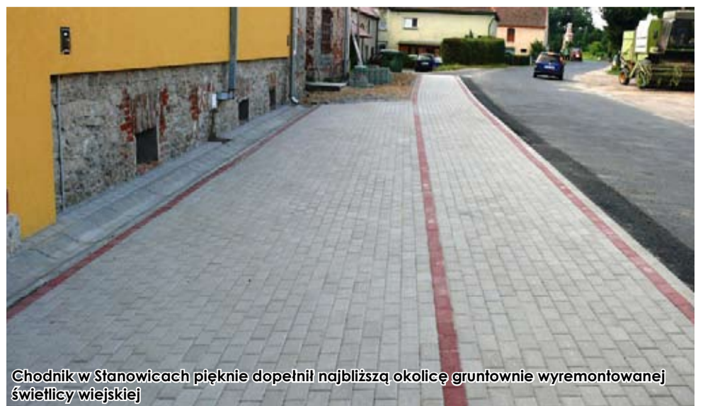
Chodnik w Stánowicach pięknie dopełnił najbliższą okolicę gruntownie wyremontowanej świetlicy wiejskiej