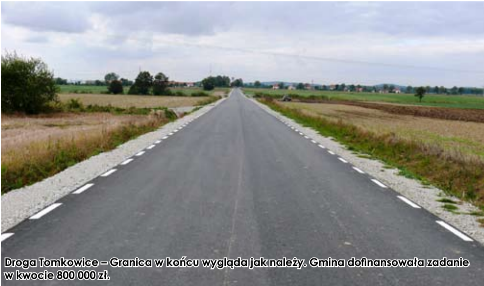
Droga Tomkowice – Granica w końcu wygląda jak należy. Gmina dofinansowała zadanie w kwocie 800 000 zł.

Bardzo dobra współpraca strzegomskiego samorządu z powiatem świdnickim owocuje wieloma remontami dróg i chodników w gminie Strzegom, szczególnie na terenie sołectw. W dzisiejszym odcinku przedstawiamy remonty dróg i chodników, które wykonane były przez Służbę Drogową Powiatu Świdnickiego w 2013 r. Remont chodników gmina Strzegom w 2013 r. dofinansowała kwotą 200 000 zł.