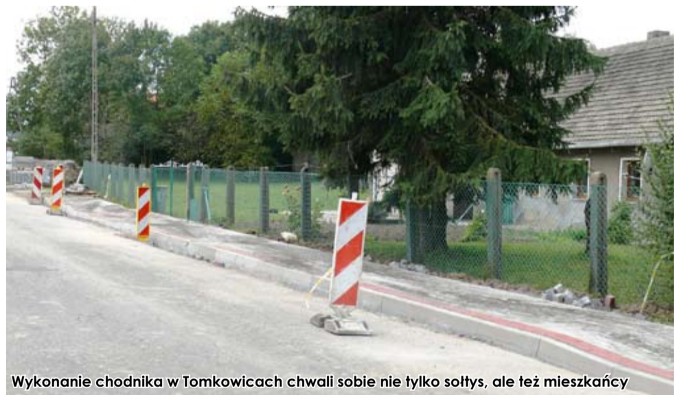
Wykonanie chodnika w Tomkowicach chwali sobie nie tylko sołtys, ale też mieszkańcy