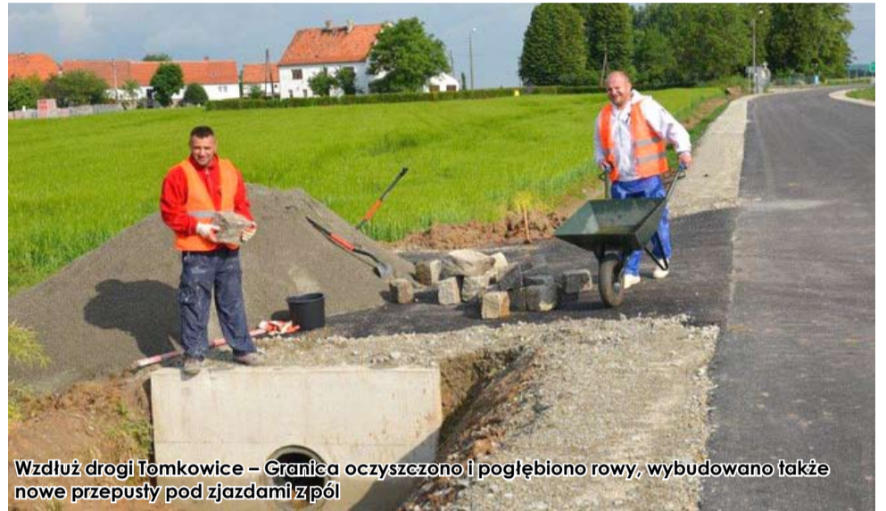
Wzdłuż drogi Tomkowice – Granica oczyszczono i pogłębiono rowy, wybudowano także nowe przepusty pod zjazdami z pól