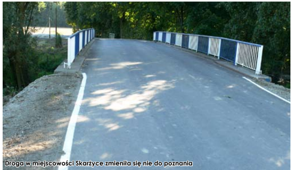
Droga w miejscowości Skarżyce zmieniła się nie do poznania