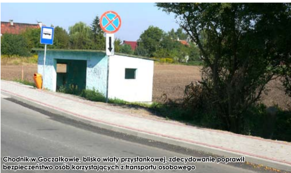
Chodnik w Goczalkowie, blisko wiaty przystankowej, zdecydowanie poprawił bezpieczeństwo osób korzystających z transportu osobowego