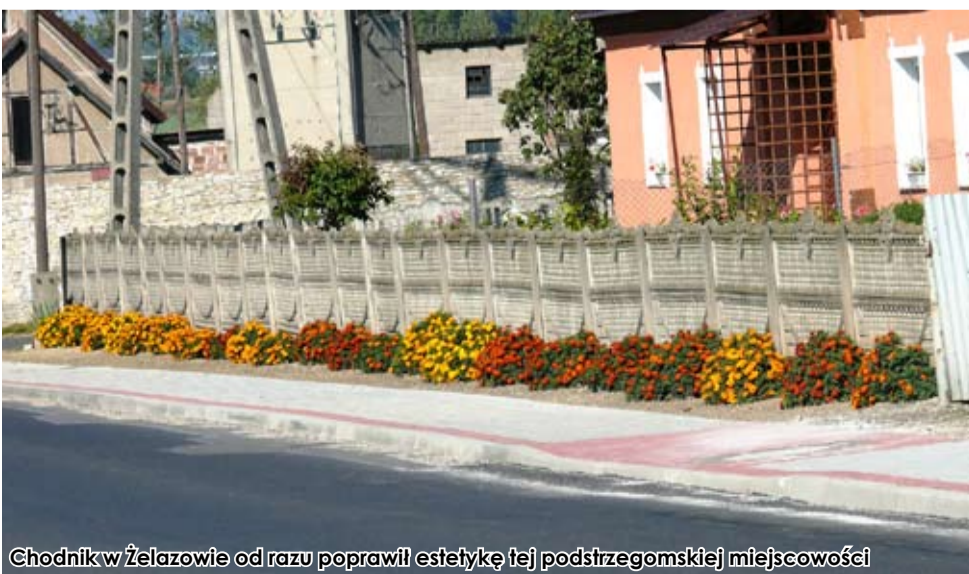
Chodnik w Żelazowie od razu poprawił estetykę tej podstrzegomskiej miejscowości