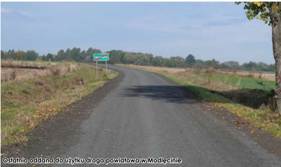
Ostatnio oddana do użytku droga powiatowa w Modlęcinie