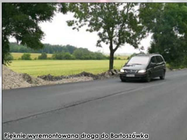
Pięknie wyremontowana droga do Bartoszówka