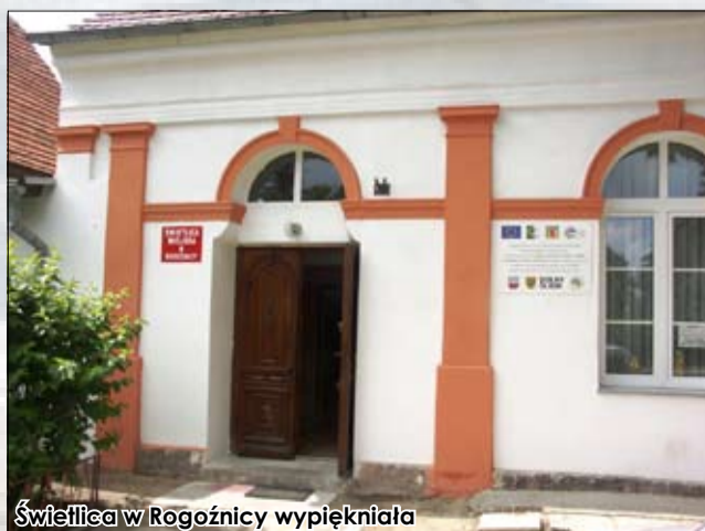
Świetlica w Rogoźnicy wypiękniała