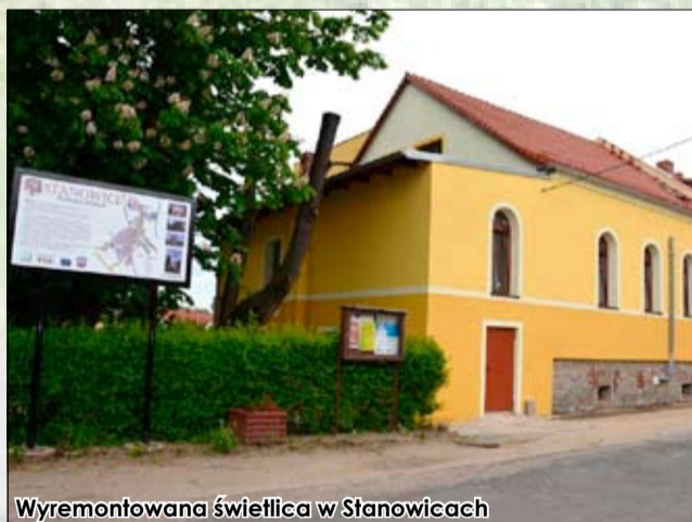
Wyremontowana świetlica w Stanowicach