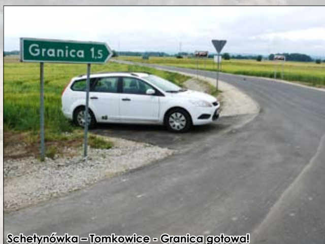
Schetyńówka - Tomkowice - Granica gotowa!