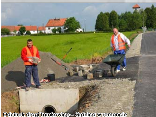
Odcinek drogi Tomkowice - Granica w remoncie