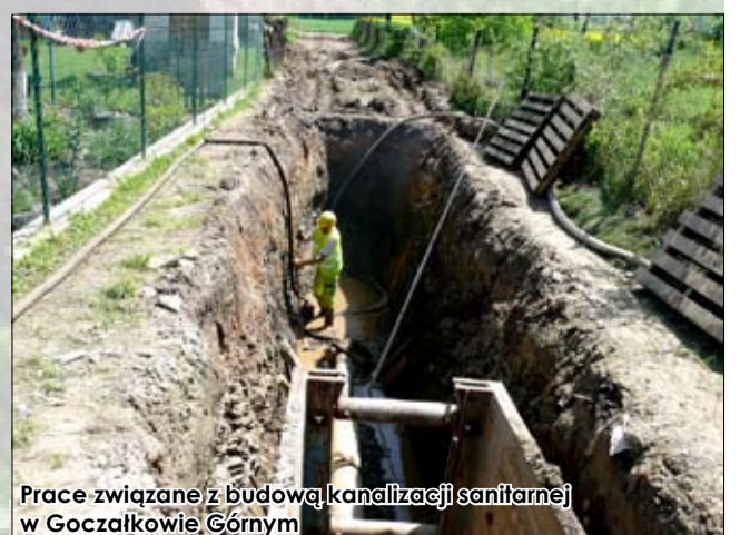
Prace związane z budową kanalizacji sanitarnej w Goczalkowie, Górnym