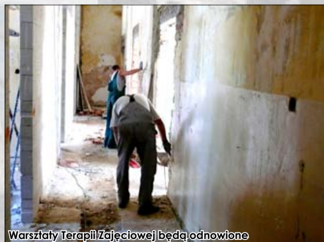
Warsztaty Terapii Zajęciowej będą odnowione