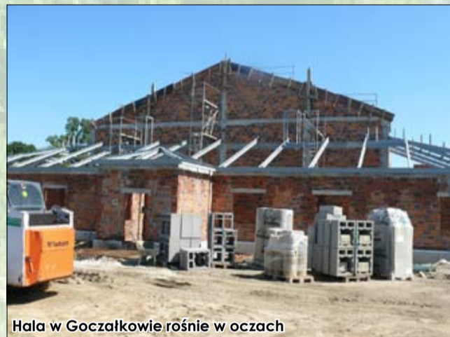
Hala w Goczałkowie rośnie w oczach