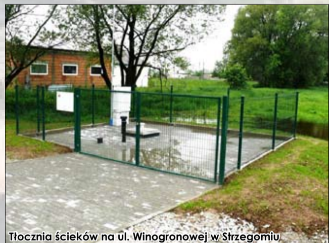
Tłocznia ścieków na ul. Winogronowej w Strzegomiu