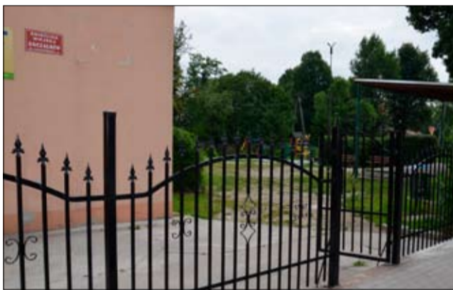
Świetlica wiejska w Goczałkowie

nastąpi w 2014 r. Warto dodać, że w tej kadencji, ze środków Unii Europejskiej w ramach