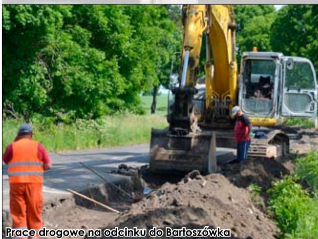
Prace drogowe na odcinku do Bartoszówka