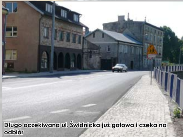
Długo oczekiwana ul. Świdnicka już gotowa i czeka na odbiór