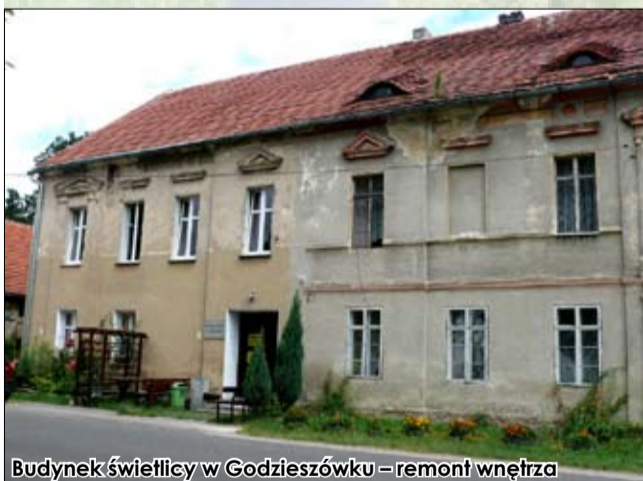
Budynek świetlicy w Godziszówku - remont wnętrza