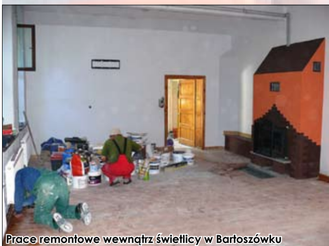
Prace remontowe wewnątrz świetlicy w Bartoszówku