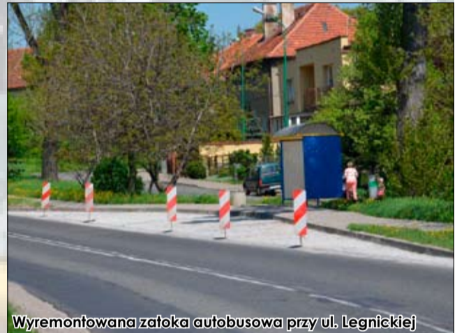
Wyremontowana zatoka autobusowa przy ul. Legnickiej