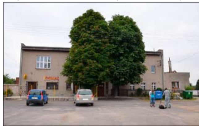
Świetlica wiejska w Olszanach

tylko do remontu świetlicy w Modlecinie oraz wymiana ogrzewania w Rogoźnicy.