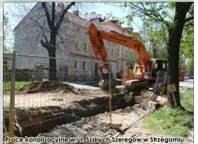
Prace kanalizacyjne w ul. Szarych Szeregów w Strzegomiu

Zadanie zakończone. Wybudowana została kanalizacja o długości 160 m oraz sieć wodociągowa z przyłączami o łącznej długości ok. 140 m.