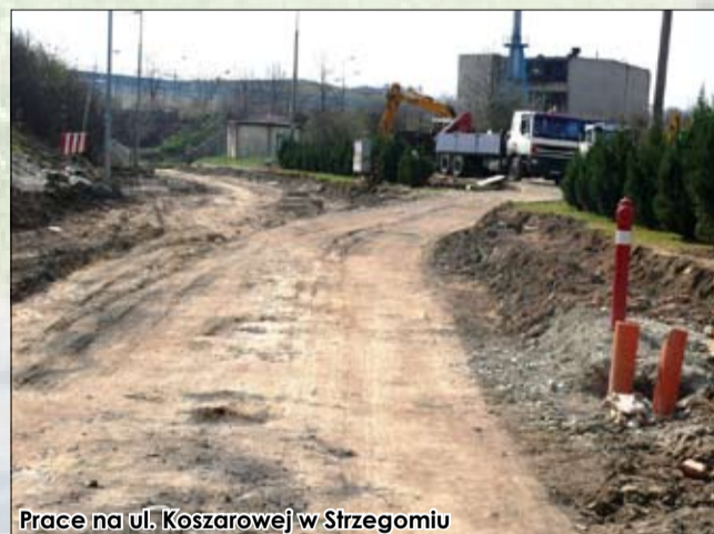
Prace na ul. Koszarowej w Strzegomiu