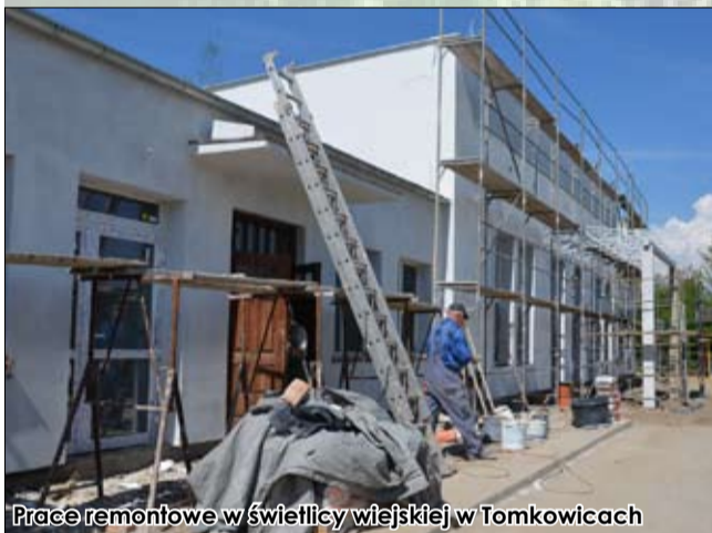
Prace remontowe w świetlicy wiejskiej w Tomkowicach

Zgodnie z porozumieniem ze Starostwem Powiatowym w Świdnicy wykonana została przebudowa drogi powiatowej na odcinku od Tomkowic do Granicy. Gmina dołożyła, zgodnie z porozumieniem ponad 840 tys. zł. Łączna wartość inwestycji przekroczyła 1 700 000 zł. Dodajmy, że strzegomski samorząd współfinansuje kwotą 200 tys. zł powiat świdnicki - środki te zostaną wykorzystane do przebudowy odcinków chodników we wsiach Żelazków, Goczałków, Tomkowice i Stanowice.