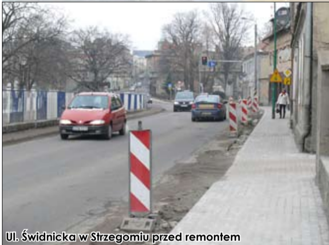
Ul. Świdnicka w Strzegomiu przed remontem